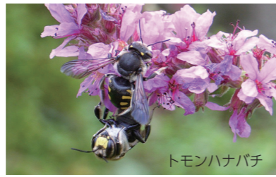
絶滅のおそれのある野生動植物をレッドデータブックにまとめ、その保護に努めます