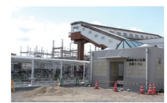
黒磯駅東口の整備が一部完了。今後は並行して、西口の整備を進めます