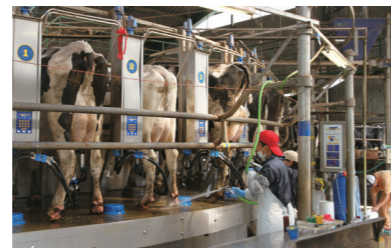
畜産施設の整備費を補助し、強い農業づくりを進めます