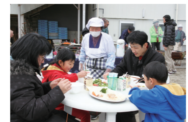
定住促進に向けて、市民と一緒に本市の魅力を発信します