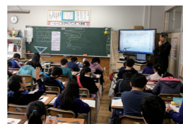
小・中学校のハード・ソフト両面を充実させ、子どもたちが学びやすい環境づくりを進めます