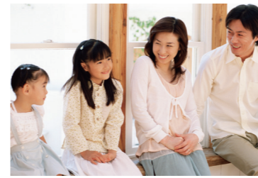
子どもや高齢者など家族全員が安心して暮らしていけるように、さまざまな事業でサポートします