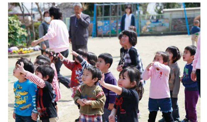
↑保育園の整備など保育環境の充実に図ります