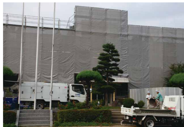
↑小中学校の耐震改修工事を進めます