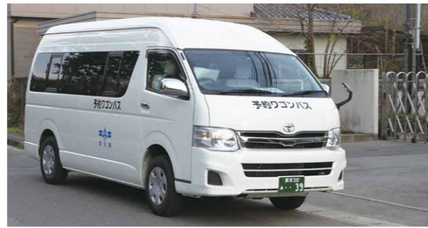
↑市民にとって利用しやすい地域バスを目指します