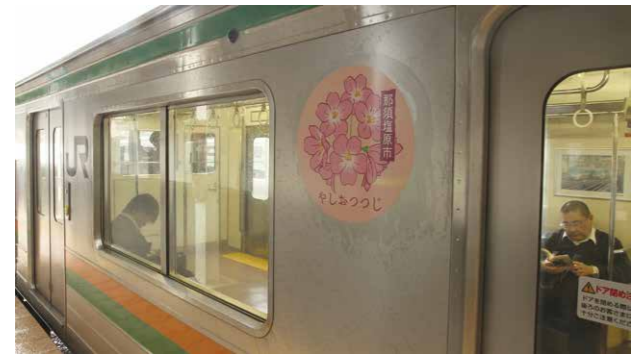
↑JRとタイアップして観光振興を推進します