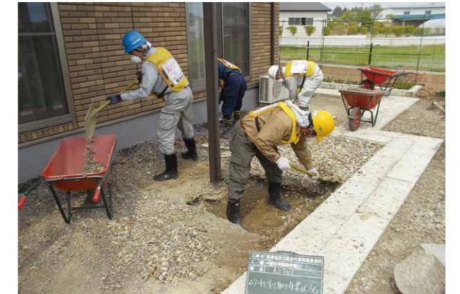
↑今年度も引き続き住宅除染作業を行います