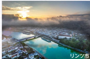
海外姉妹都市提携10周年記念事業