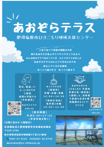
ひきこもり支援事業