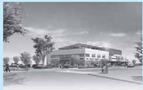
商業等活性化の拠点となる「そすいスクエア アクアス」完成予想図

【主な使いみち】 ・一本杉ふれあいスペース用地購入費 1,010万円 ・まちづくりイベント支援など補助金 548万円