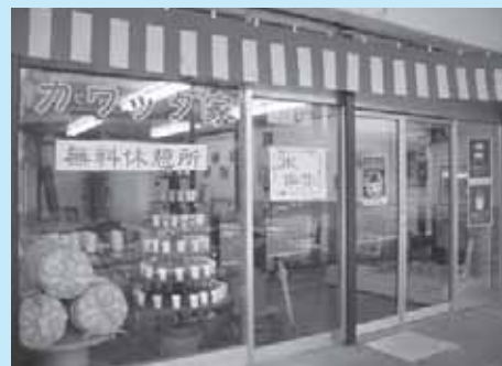
空き店舗を利用した黒磯駅前にある無料休憩所「カワツタ家」