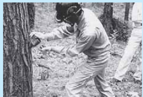
薬剤の樹幹注入の様子