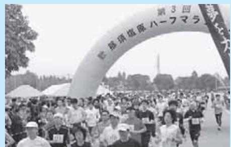
那須塩原ハーフマラソンを開催します