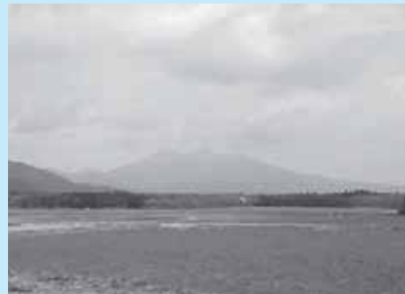
大切に守りたい農村の環境