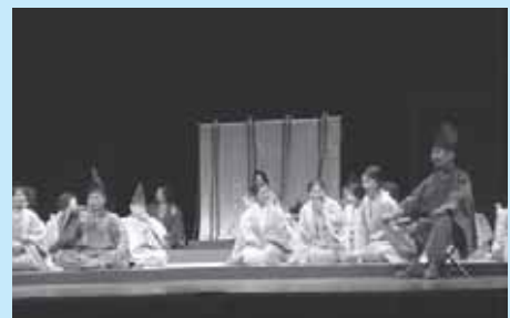
オペラ「殺生石物語」