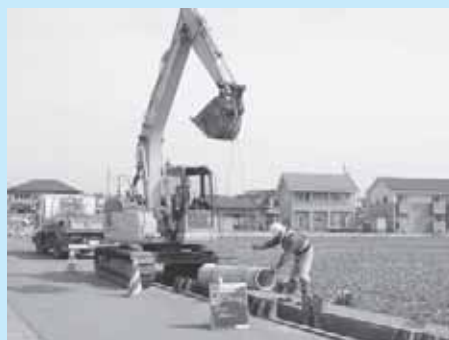
下水道工事の様子