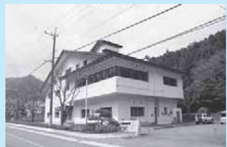
塩原水処理センター