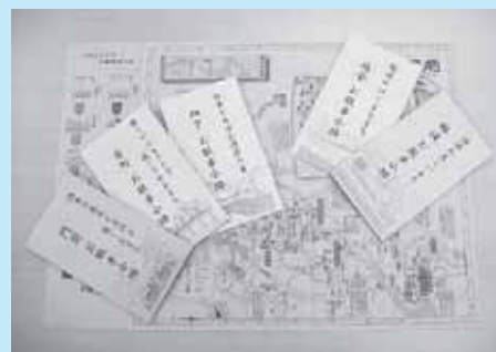
塩原温泉観光マップ「お散歩小路」 (塩原温泉活性化推進協議会作成)