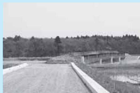
金沢・高阿津農道 橋りょう上部の工事を行います