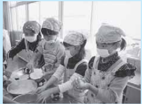
おにぎりづくりの体験学習 自分でつくと美味しいね!