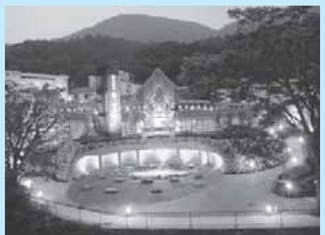
日本最大級の足湯施設 湯っ歩の里