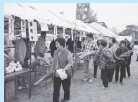
公民館まつりの様子