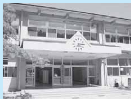
宿泊体験館メープル (旧上塩原小学校校舎活用)

【主な使いみち】 ・光熱水費 1億1,496万円 ・管理用消耗品費 4,355万円 ・設備管理業務などの委託費 3,792万円