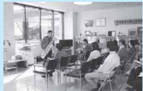
黒磯庁舎市民室を利用したロビーコンサートの様子