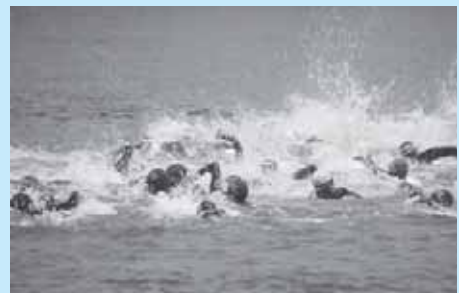
トライアスロン「スイム」の様子