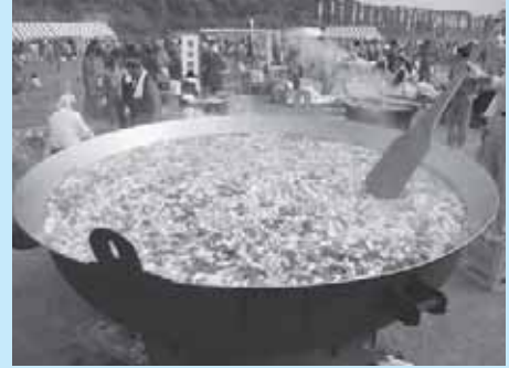
巻狩大将なべで豪快に作ります うまい！