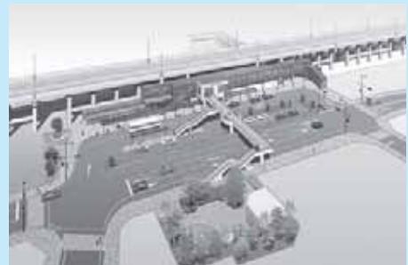
西那須野駅西口広場完成予想図

【主な使いみち】 ・駅東西連絡通路改修費 2億8,439万円 ・駅西口広場整備費 2億6,458万円 ・中央通り整備費 1億5,683万円 ・駅西口駐輪場整備費 1億2,356万円