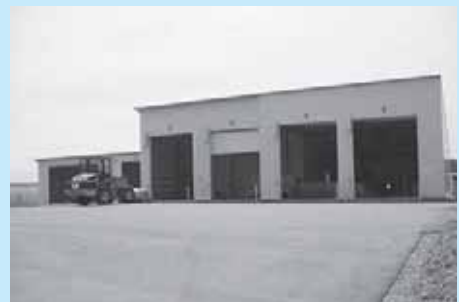
循環型社会を目指す堆肥センター 製造堆肥の販売も行っています