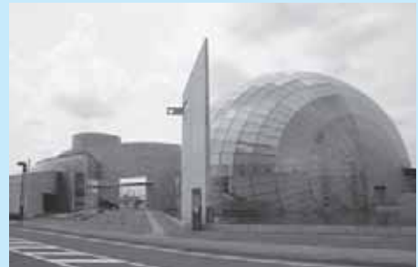
那須野が原ハーモニーホール