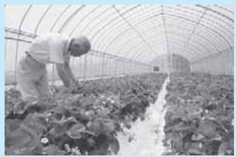
愛情をもって育てています