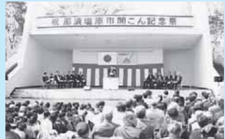
開こん記念祭の様子