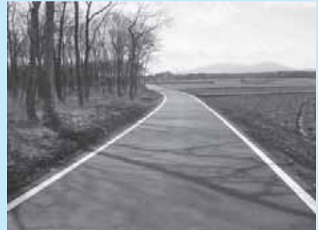
整備された農道（野間地区）

松くい虫による松の被害防止と被害拡大を防止するため、薬剤の樹幹注入や伐倒処理を行います。