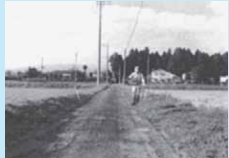
整備前の農道（北赤田地区）