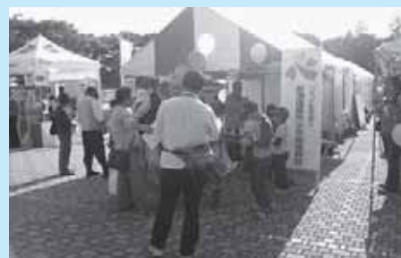
少年指導員活動の様子