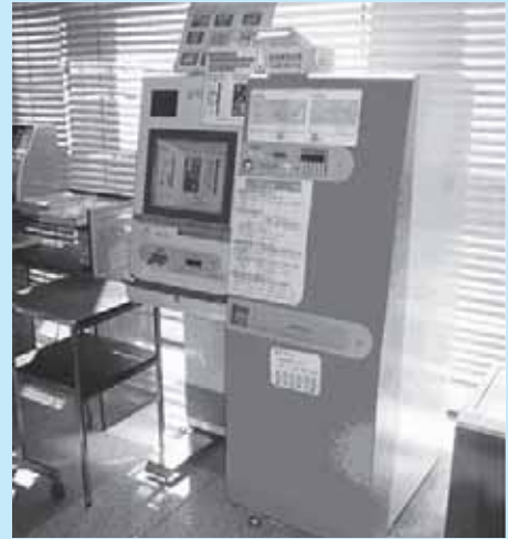
住民票等自動交付機(西那須野庁舎)