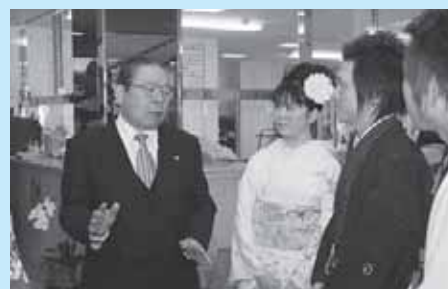
新成人と語り合う栗川市長