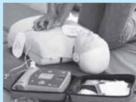
自動体外式除細動器(AED)