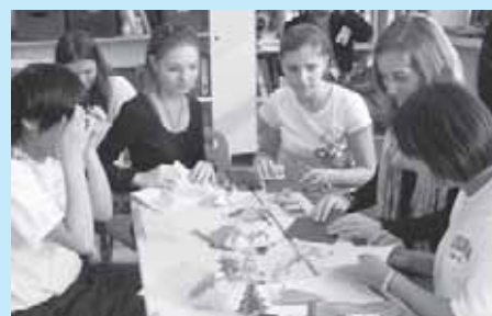
海外の生徒たちとの交流