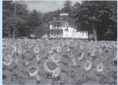
青木邸（旧青木家那須別邸）