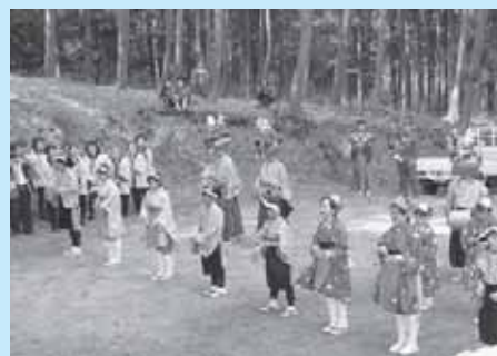
無形民俗文化財「百村の百堂念佛舞」