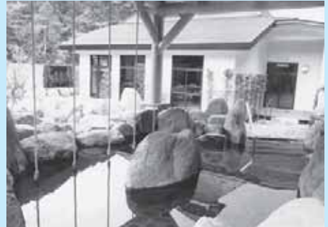
自然を眺めることのできる「網の湯」