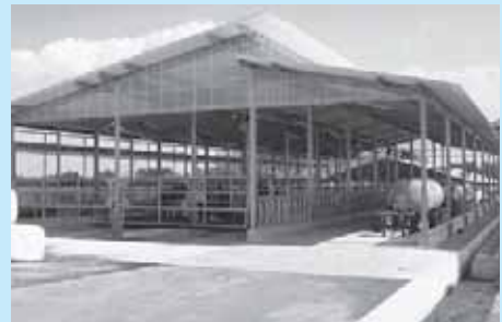
補助を受けて整備した畜舎