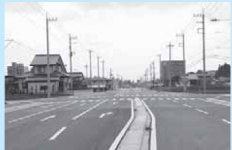
北土地区画整理地内の道路