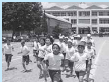
きょうもげんきに遊ぶぞ!