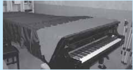
オーバーホールを待つグランドピアノ