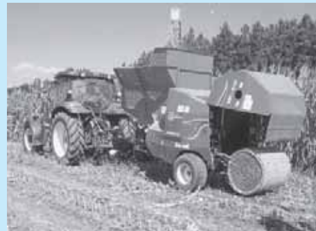
飼料作物収穫用の機械