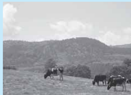
放牧でのびのびと過ごす牛たち