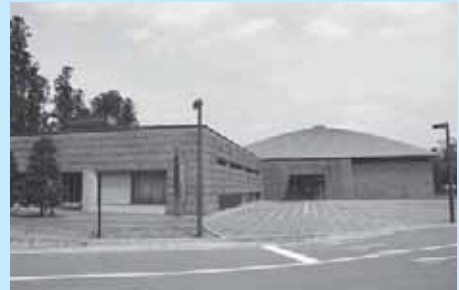
那須野が原博物館