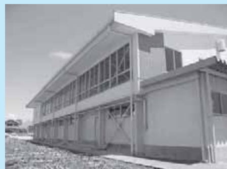
大原間小学校体育館