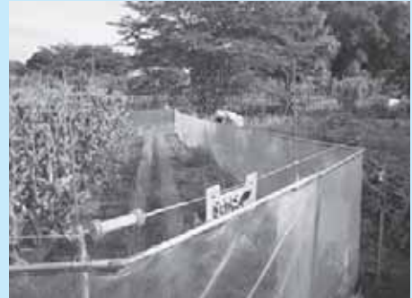
電気柵設置を支援します

【主な使いみち】 ・ 捕獲などの委託費 788万円 ・ 被害対策費補助金 220万円