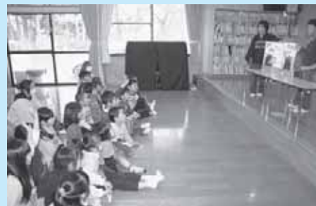
図書を通じた児童の交流

国際社会に貢献する人材の育成や国際交流、異文化交流を通じた相互理解・国際理解を図るため、中学2年生約37名について1週間にわたる海外(オーストリア)派遣を行います。