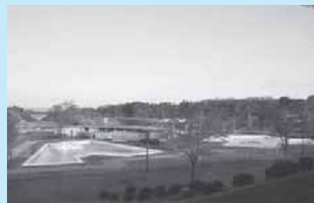
那珂川河畔公園プール