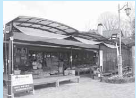
青木ふるさと物産センター