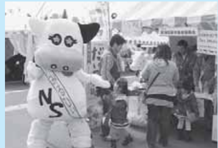
たくさん牛乳飲んでね♡みるひい

【主な使いみち】 ・ 畜産団体活動補助金 2,039万円 ・ PR活動費（チラシ・バッジ作成） 26万円