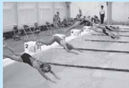
塩原B & G海洋センタープール