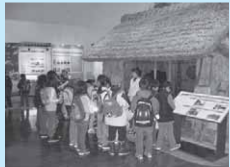
むかしのくらしが展示されています