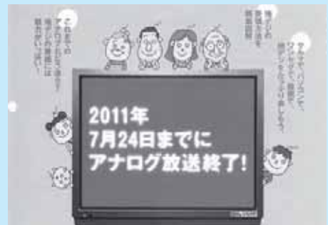
デジタル放送難視聴地域調査を行います