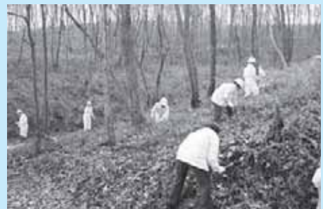
里山づくり事業の様子