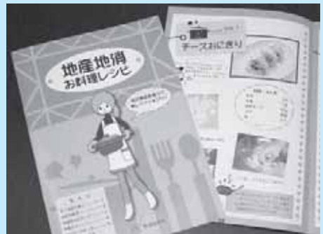
農村生活研究グループによる地産地消レシピは、「広報なすしおばら」の裏表紙でも紹介しています