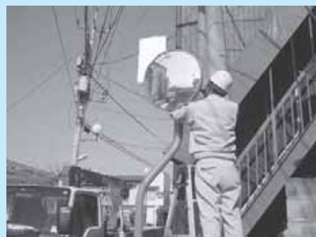
カーブミラー整備の様子