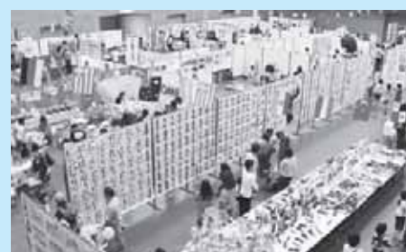
産業文化祭（にしなすの運動公園体育館）