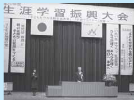
生涯学習振興大会を開催します