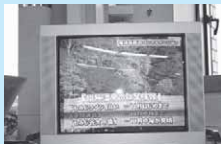
「那須塩原市インフォメーション」 とちぎテレビで毎週水曜日 夕方6時30分ごろから放送中です