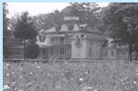
青木邸(旧青木家那須別邸)