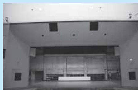
黒磯文化会館大ホール