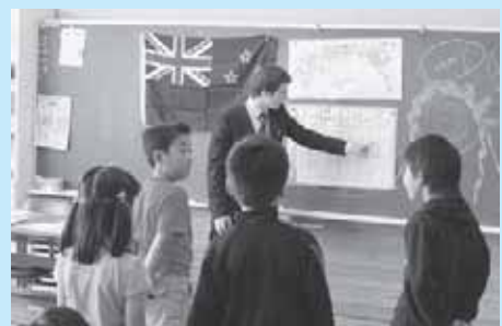
英語ならまかせて