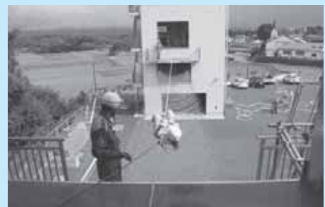
消防署にて新人研修