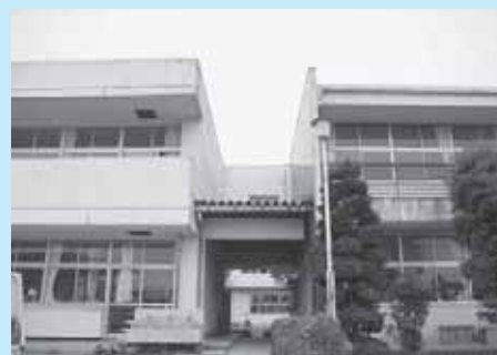
西那須野中学校教室棟