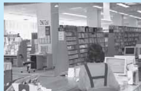
たくさん利用してくださいね