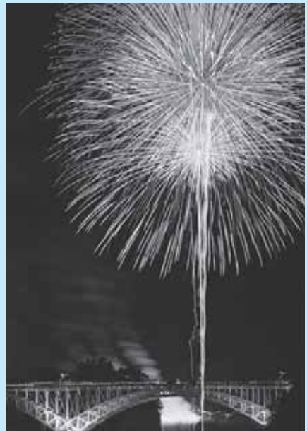
夏の夜空を彩る花火大会