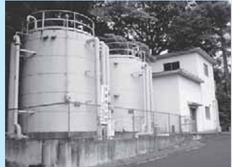
上・中塩原温泉供給施設