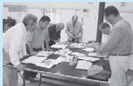
みんなの力で「地域マップ」作成