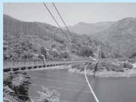
もみじ谷大吊橋 全長320mを誇ります