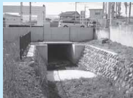
排水路整備を進めます