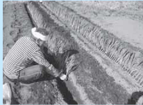
美味しい野菜をつくります！