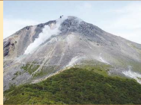
那須岳の火山活動について 1408年から1410年の活動時に、火砕流が発生し、さらに茶臼岳溶岩ドームが形成されました。この噴火で180余名が犠牲になりました。