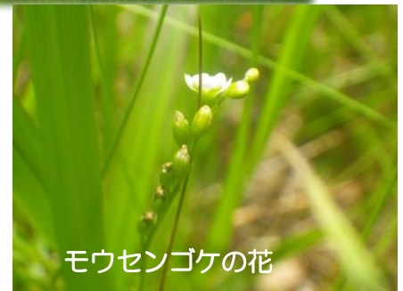
モウセンゴケの花