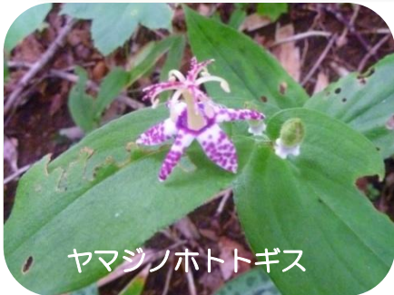
ヤマジノホトトギス