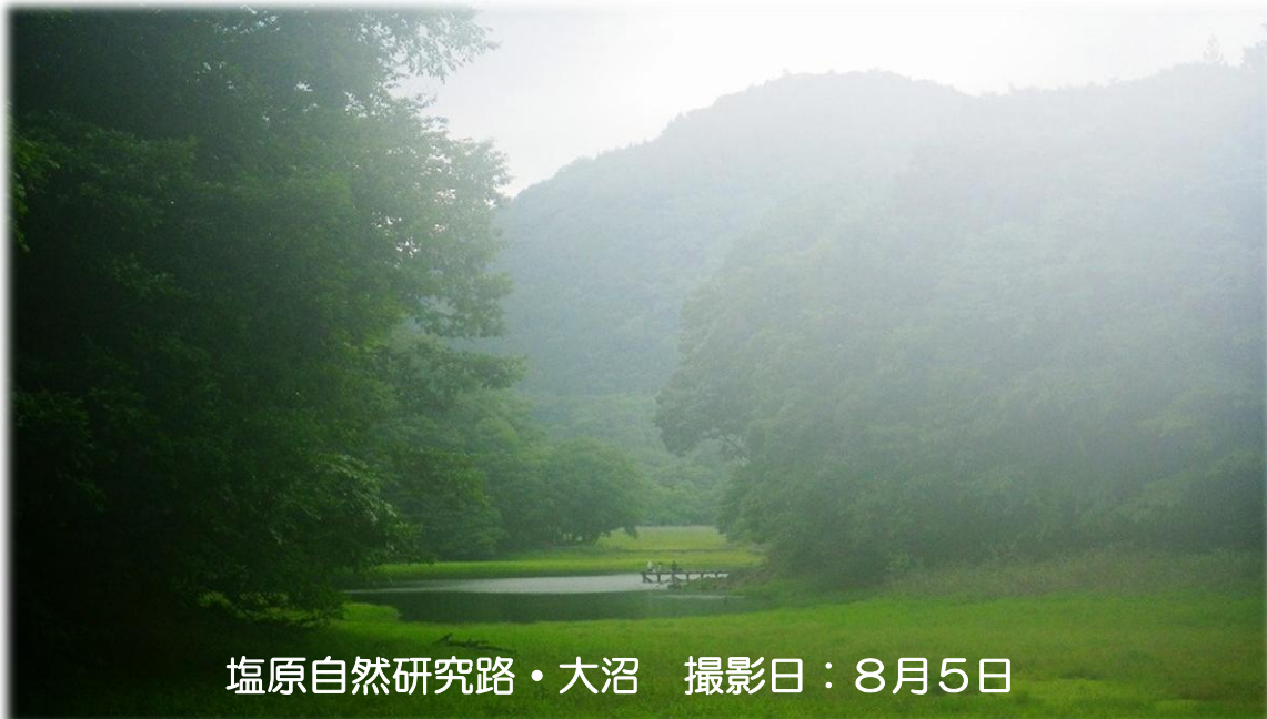
塩原自然研究路・大沼 撮影日：8月5日