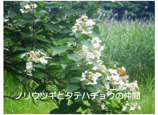
ノリウツギとタテハチョウの仲間