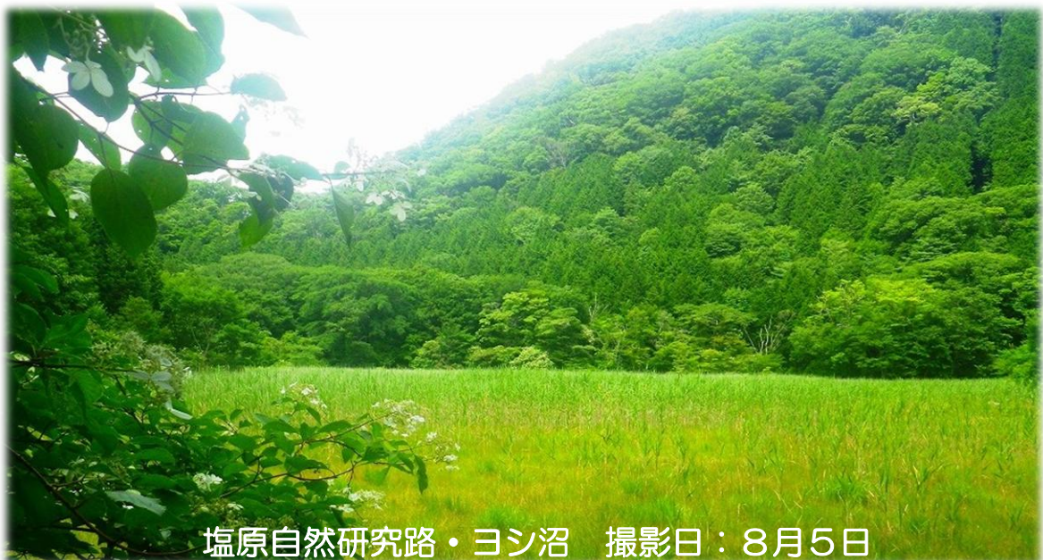
塩原自然研究路・ヨシ沼 撮影日：8月5日