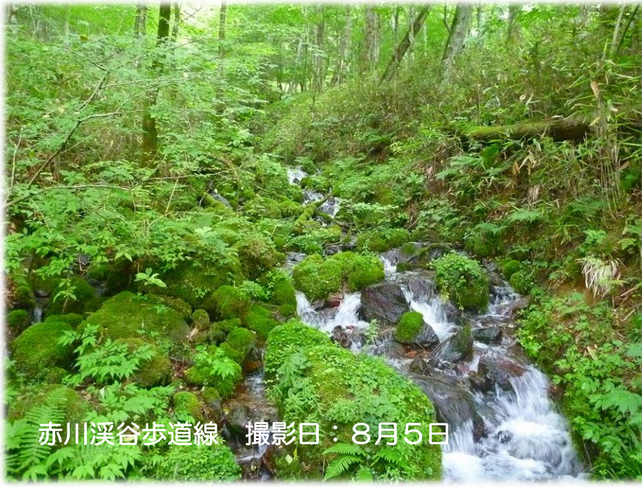
赤川溪谷歩道線 撮影日：8月5日