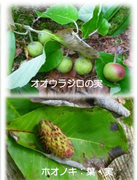
オオウラジロの実