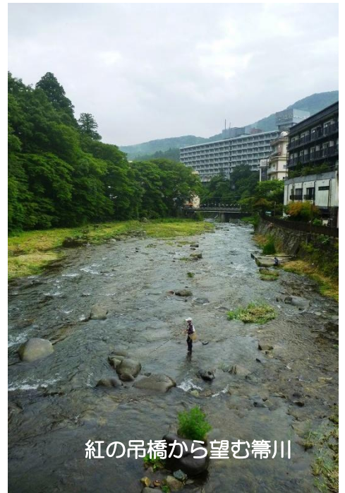
紅の吊橋から望む箒川