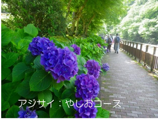
アジサイ：やしおコース