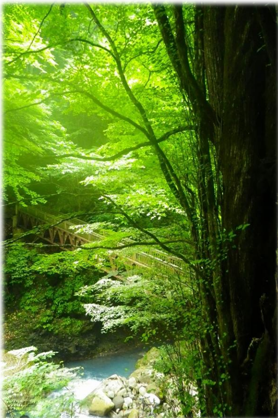
大カツラとスッカン橋