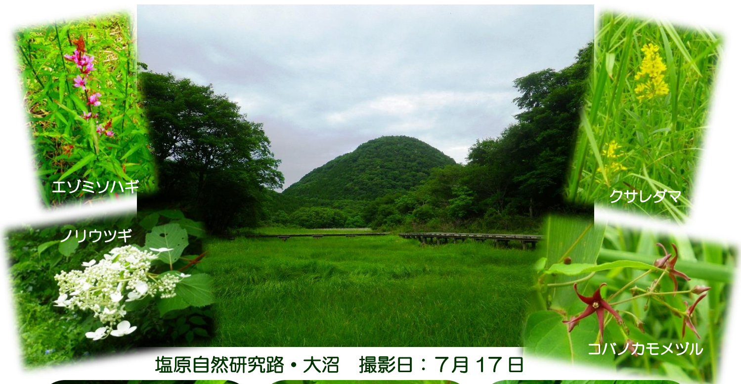
塩原自然研究路・大沼 撮影日：7月17日