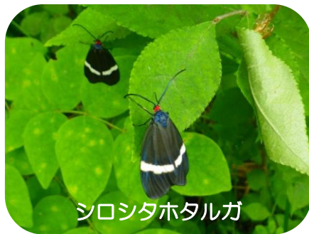
シロシタホタルガ