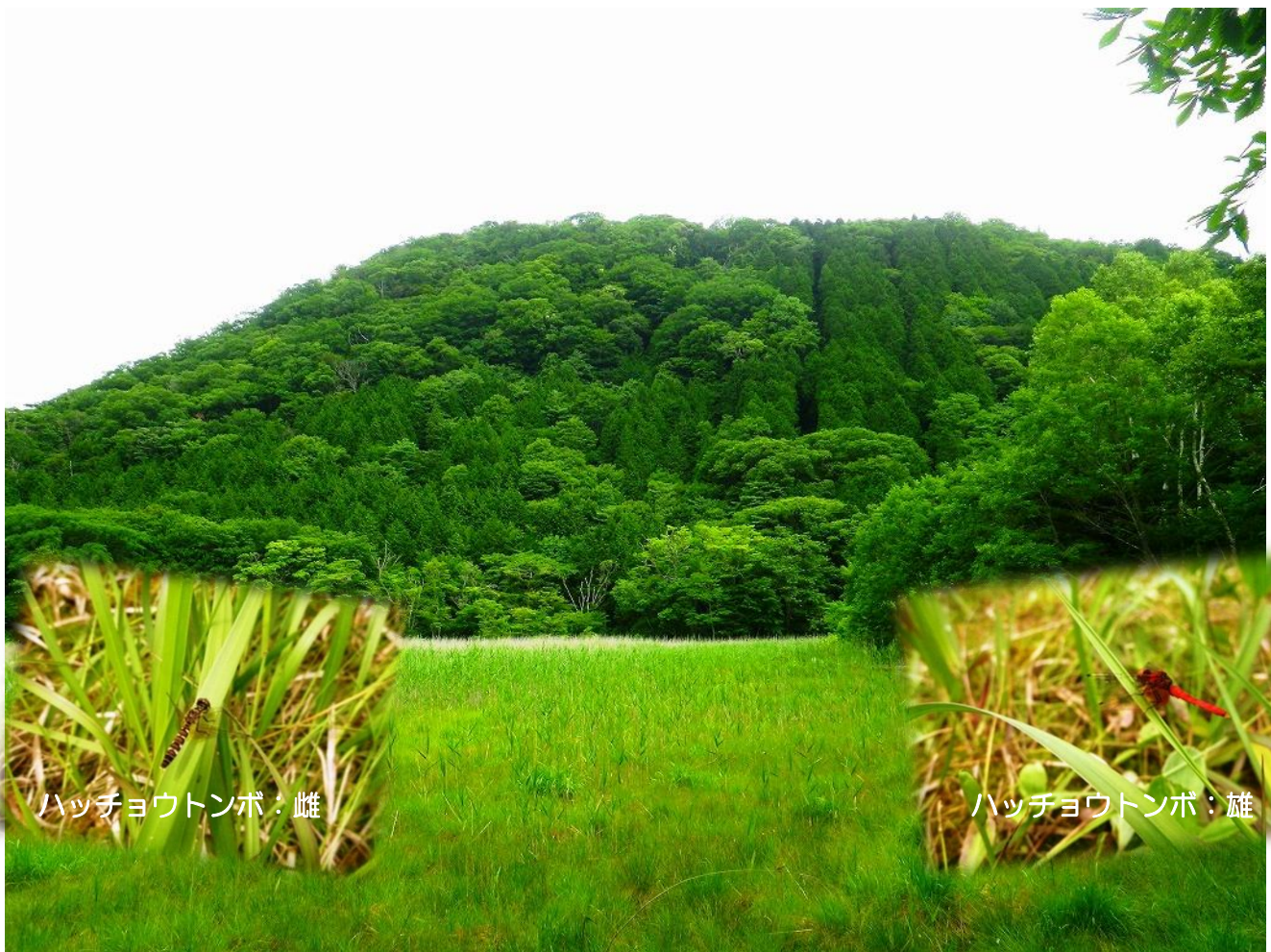
ハッチョウトンボ：雌