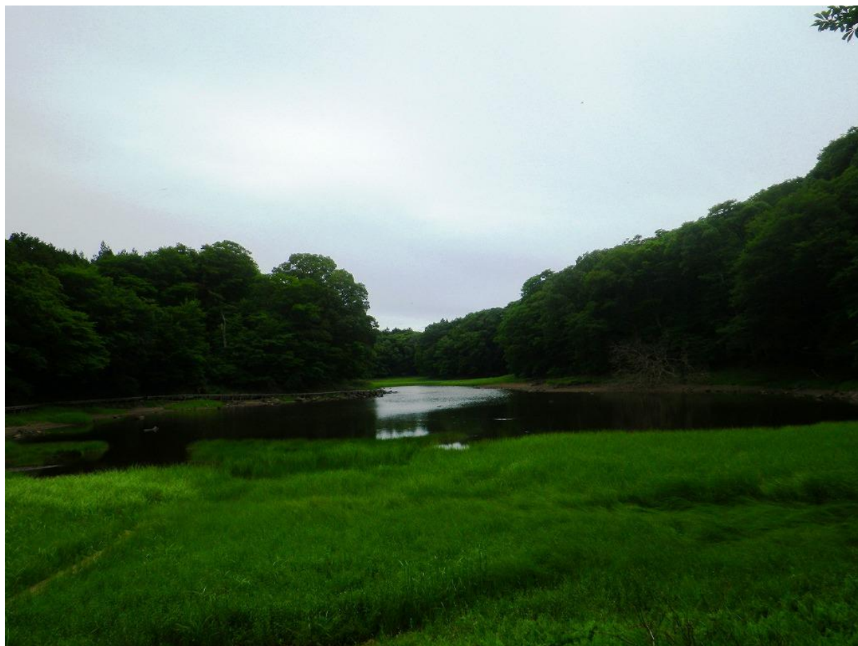
木道より大沼を望む