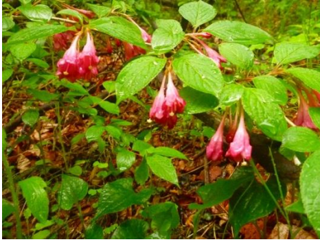
ベニバナニシキウツギ