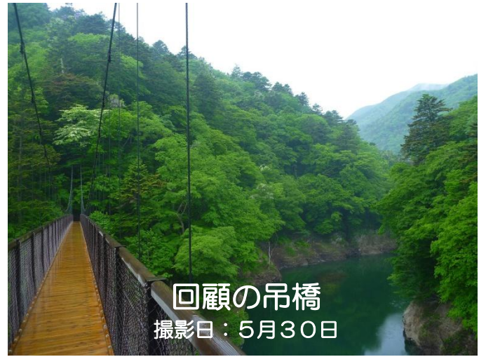
回顧の吊橋 撮影日:5月30日