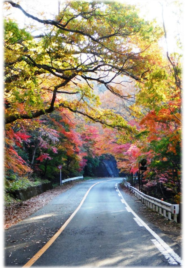
旧400号回顧トンネル周辺