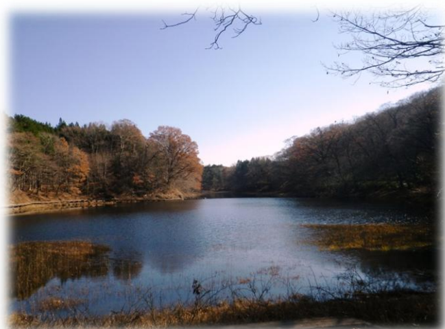
大沼木橋からの「新湯富士」「大沼」