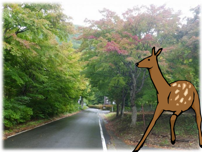
塩那スカイライン入口