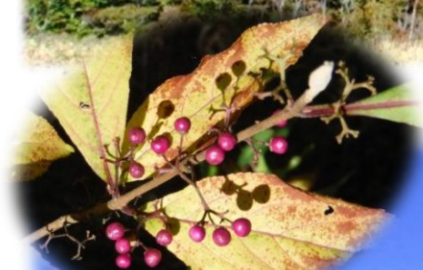
ムラサキシキブの果実