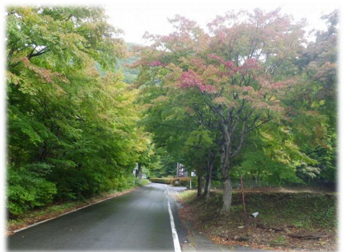
塩那スカイライン入口