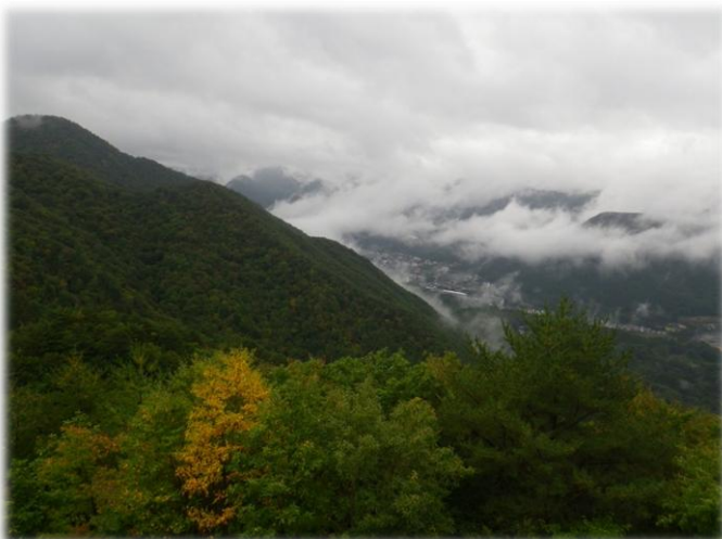
塩那スカイラインからの温泉街