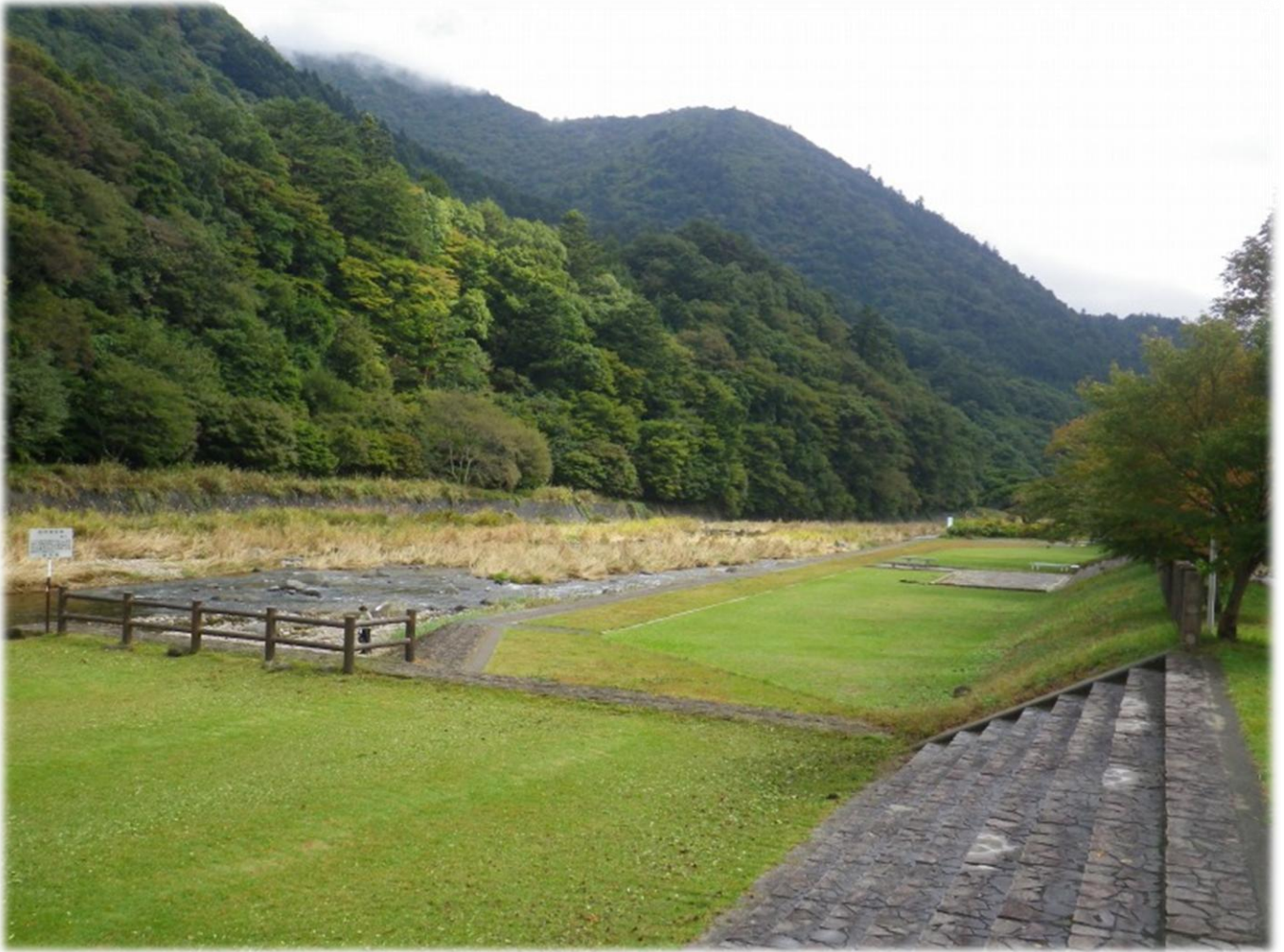
古町県営駐車場：箒川沿い