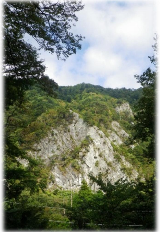
ビジターの森からの天狗岩