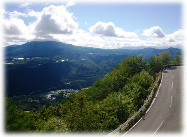
塩那スカイライン