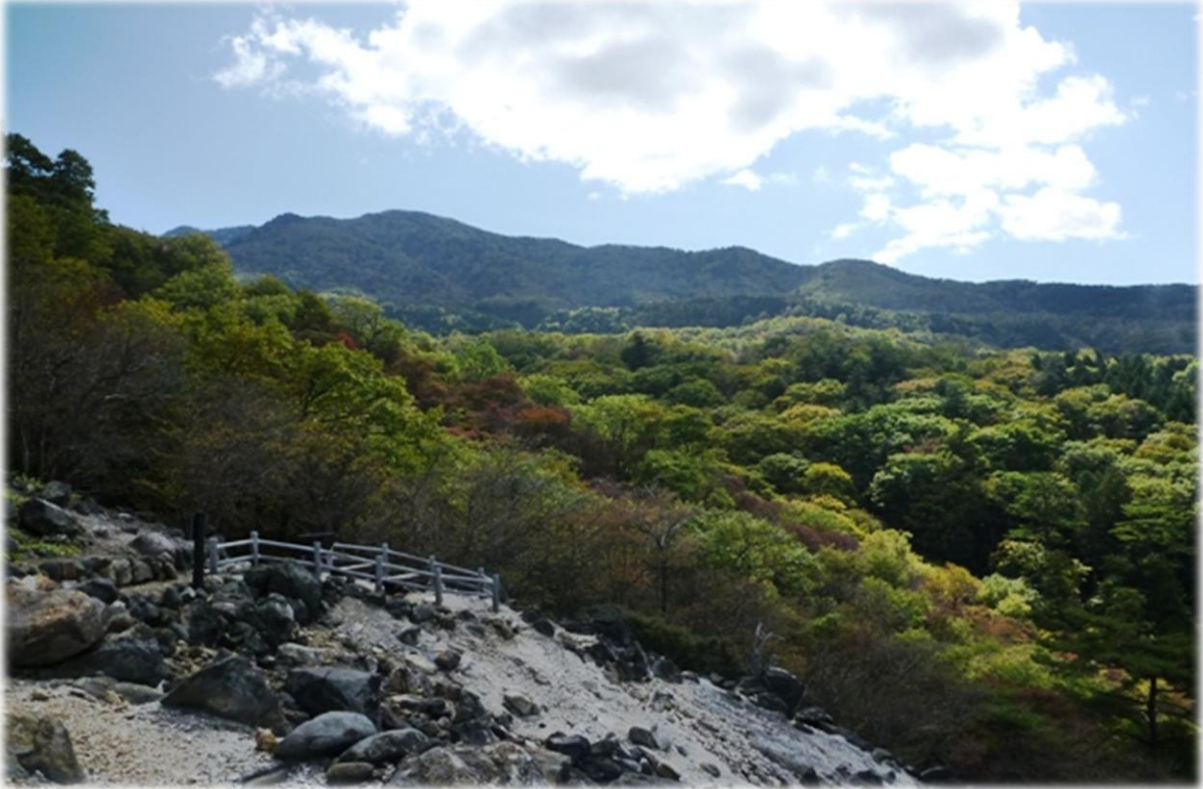
新湯温泉：自然研究路より

皆様も秋を感じられるようになりましたか？ 塩原温泉も少しずつ秋の装い、紅葉もすぐそこに！ 塩原温泉の今週の状況をお知らせします。