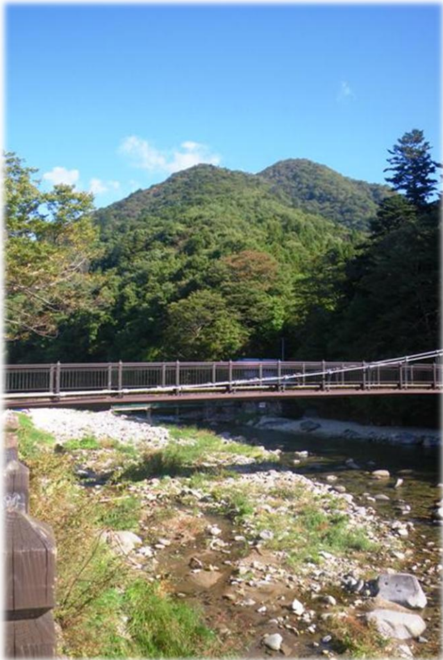
紅の吊橋（もの語り館裏）