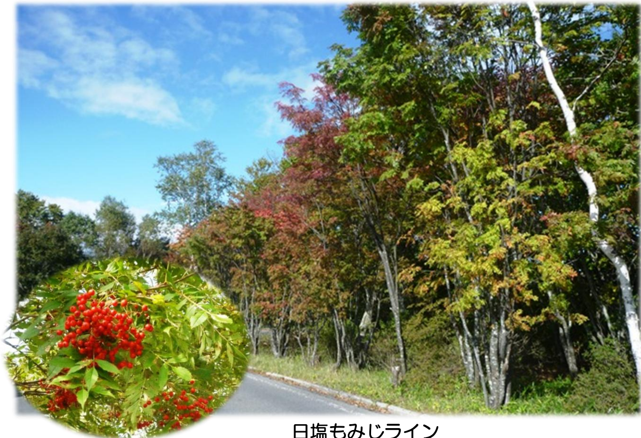
日塩もみじライン