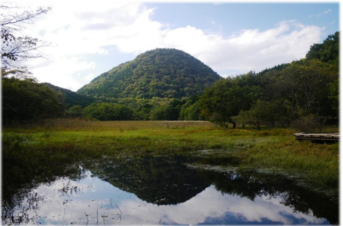
台風 17 号により大沼が増水しています。 撮影日は 2012.10.11 です。