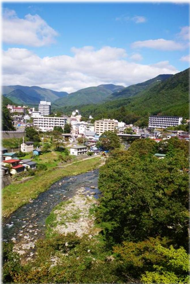
弁天大橋から温泉街を望む