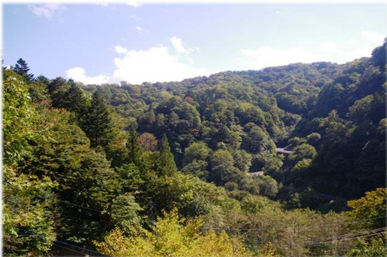
雄飛トンネルより(奥塩原矢板線)