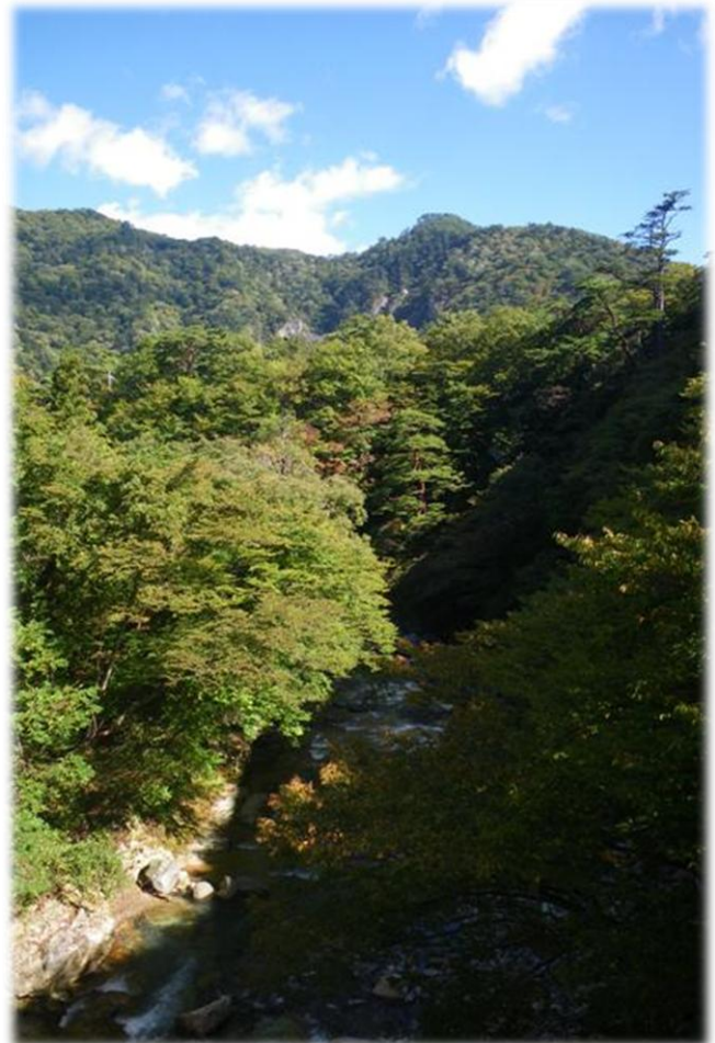
四季の里橋からの景色（塩釜地区）