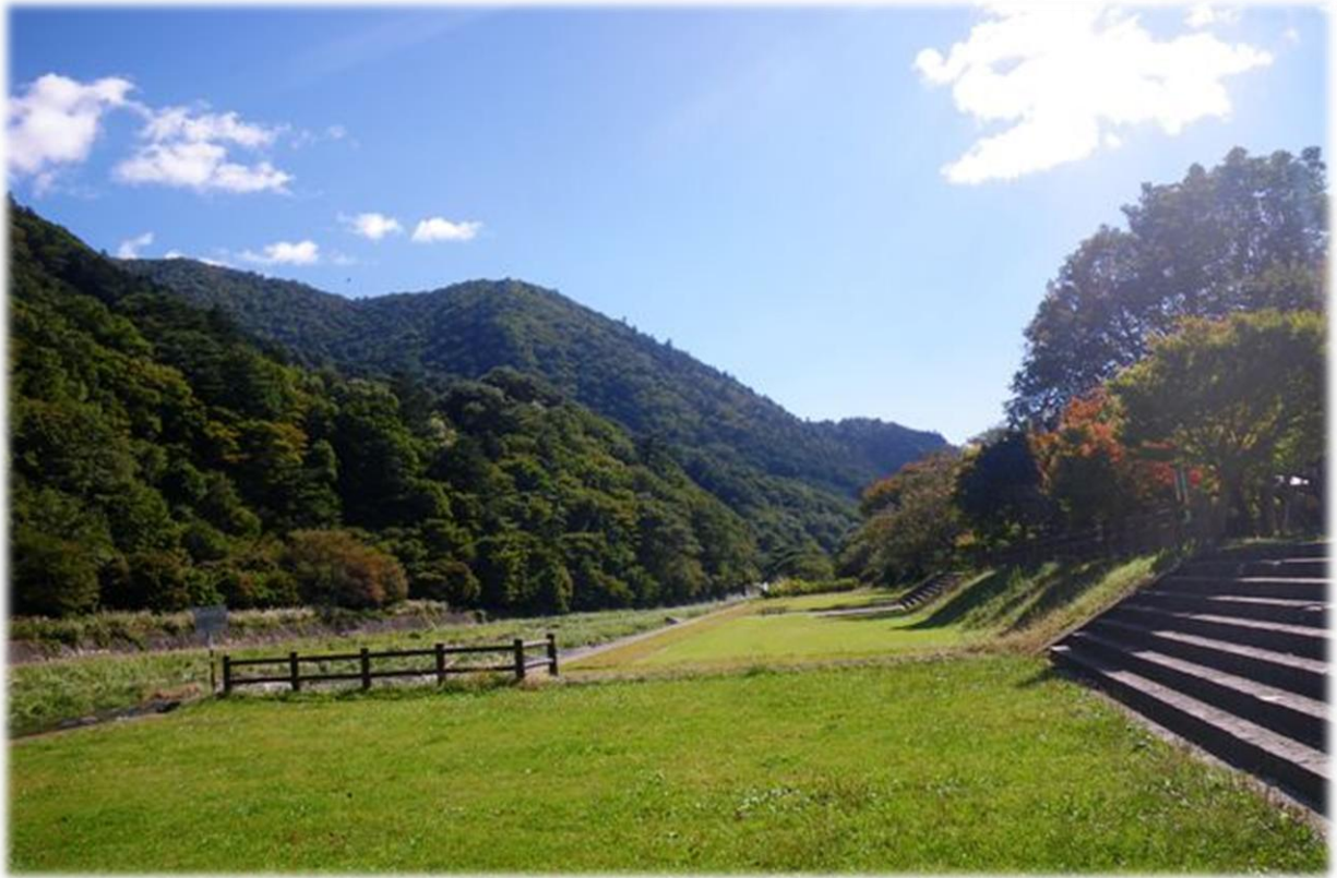
古町県営駐車場裏