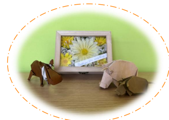
発達支援システム利用者とその保護者の作品

個別の指導計画と引継ぎシートは、 学校等の担当職員が保護者と話し合いながら作成して いきます。作成された個別の指導計画と引継ぎシートは、発達支援システムにフェイスシートと合わせて提供され、「個別の支援計画」として保管します。