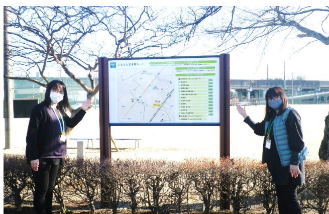
【狩野地区のフットパスパネル】