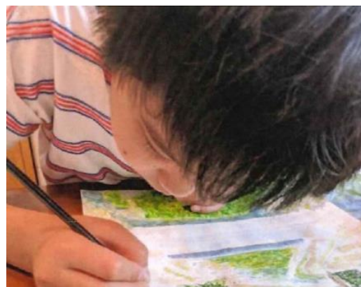
【集中して取り組む児童】

新型コロナウイルス感染拡大に伴う緊急事態宣言発令により、例年実施していた表彰式が中止となってしまいましたが、学校を通じて表彰していただき、子どもたちの自信につながったことと思います。