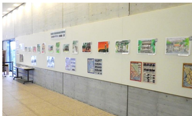
【那須野が原博物館】