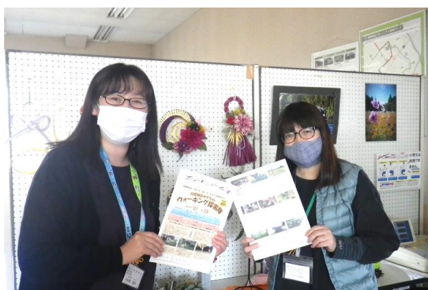
【スタンプウォークラリーの台紙】

当初はコミュニティ内の周知でしたが、口コミで地区外の方も多く参加いただき、サテライト巡りを通じて狩野地区の魅力を体感いただくことができました。