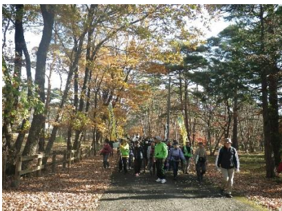
松方別邸周辺の散策路

10月に市の広報等で参加者を募集する予定ですので、興味のある方はぜひご参加ください。