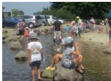
「お楽しみ会」の様子