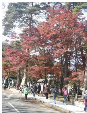
千本松牧場の紅葉