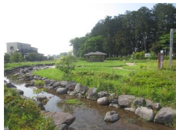
那須開墾社事務所堀（親水公園）

この堀の整備と併せて駐車場、東屋も設置。歴史公園に隣接した親水公園となりました。親水公園では毎年夏休みに入った日曜日に「お楽しみ会」と銘打って、イベントが開かれています。「水に親しむ機会（場所）が少ない子どもたちに、身近な場所で楽しんでもらいたい」と始めたイベントですが、今年で9年目の開催となりました。開催日前々日の高圧洗浄機による水路清掃、前日の除草清掃作業で綺麗になった事務所堀（親水公園）で開催される「お楽しみ会」。金魚すくい、ドジョウすくい、疏水に入っの宝探しゲームなど子どもたちのはしゃぐ声が夏空に響きます。また、事務所堀には、生物の生息環境整備の一環として「井桁護岸 いげたごかん 」が設置されています。