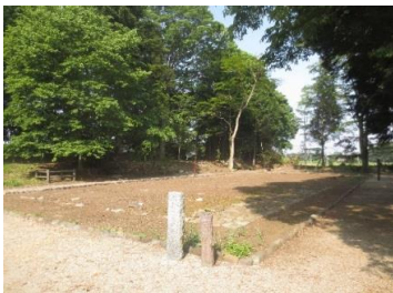
那須開墾社第二農場跡（歴史公園）

建物の礎石はそのまま保存され、外周を表す小石が並べられており、敷地の北・西・東側に築かれた暴風土手の遺構も見られます。また、敷地内の林にはフクロウの巣箱が設置され、国蝶、オオムラサキの保全活動も行われています。