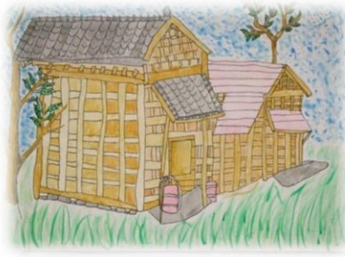
狩野コミュニティ 遅沢の板倉