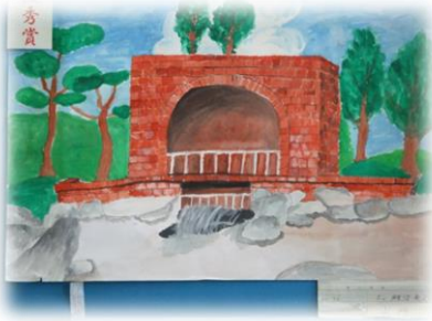
中央コミュニティ 疏水パーク

第2回小学生サテライト絵画展の出展作品を用いて田園空間博物館のサテライトを紹介します。