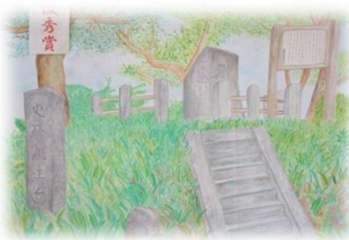
南コミュニティ 親王台