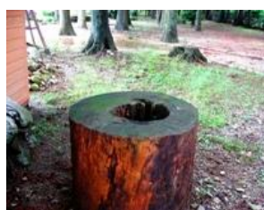
初代黒松の切り株