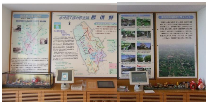
インフォメーションルーム大型パネル