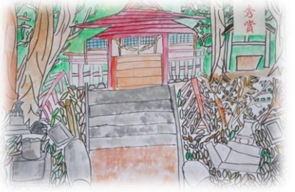
西コミュニティ 烏森神社