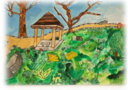
狩野コミュニティ 出釜湧水地