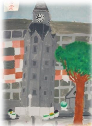
中央コミュニティ 支所庁舎時計塔