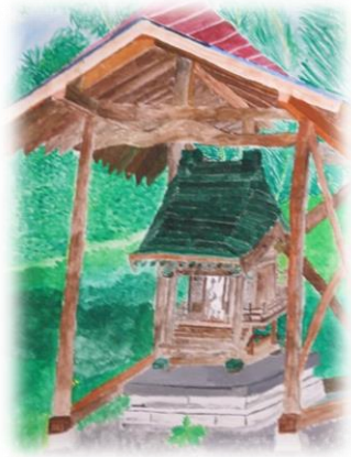
横接地区コミュニティ 八坂神社