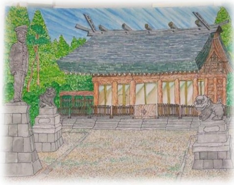
大山コミュニティ 乃木神社