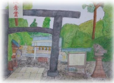
三島コミュニティ 三島神社