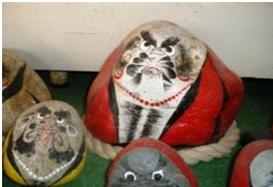
左：吉田名人の作品 石ころダルマ