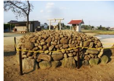
右：開拓苦難の石塚