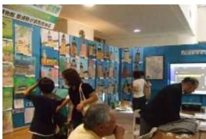
○西那須野産業文化祭の絵画展の様子