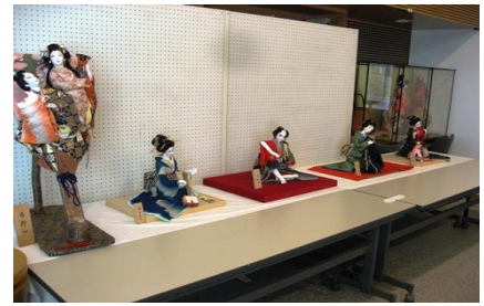
創作人形展（23年4月開催）

本年度は火・木・土・日曜日の4日間は田空を案内する解説者が、午前10時から午後2時までの4時間入館者に解説をしております。