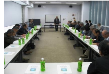
平成23年度総会の様子