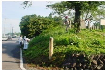
サテライト（親王台）清掃の様子 南地区コミュニティ