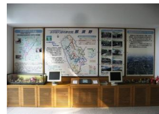
大型パネル案内板

間もなく、大型パネル案内板の改修を行う予定です。開設から8年目になり、サテライトの変更増加に伴い、改修が必要になりました。なお、一部の設備につきましては、節電のため使用を休止しております。