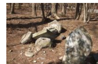
谷中開墾跡地六地藏