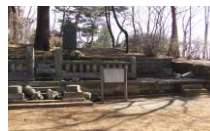
常磐が丘賢人墓地

右の写真は東日本大震災での破損の状況の一部です。各コミュニティからの報告は4頁に掲載しました。なお、破損しているサテライトの見学には十分な注意をして怪我などがないようにして下さい。