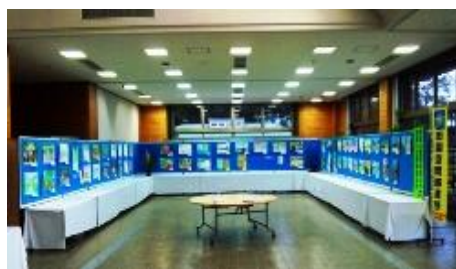
22年度『水が拓く緑の夢空間』写真展