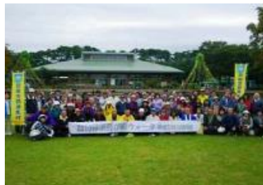
第7回那須野が原ウォーク