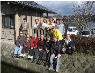
○那須疏水水車の前で集合写真