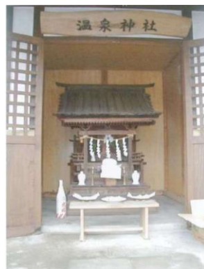
南郷屋公民館温泉神社