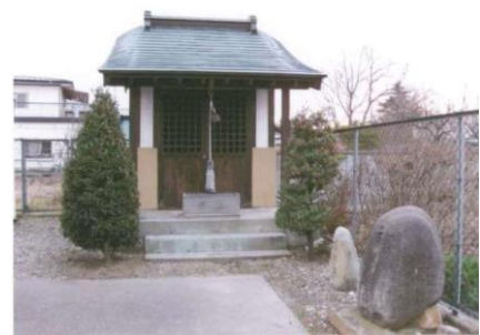
南郷屋公民館温泉神社と原街道道標