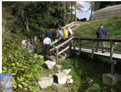
○出釜湧水地【狩野地区】