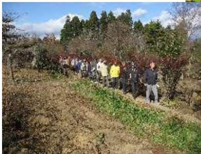
○ホテルの里【南地区】