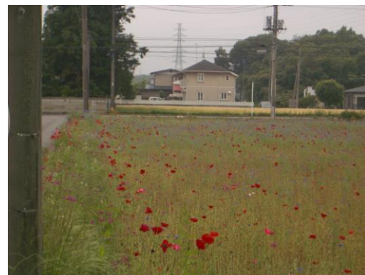
(写真)南コミュニティのお花畑