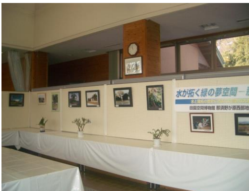
(写真)那須野が原公園での写真展