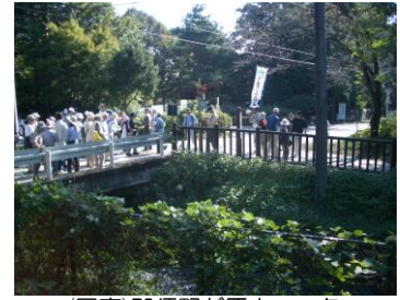
(写真)那須野が原ウォーク