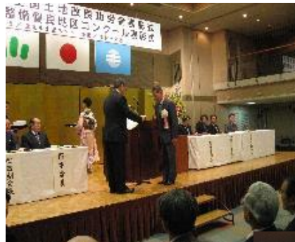
(写真) 表彰式の様子

平成20年3月27日(木)東京都千代田区「シェンバッハ・サポー」において、平成19年度農業農村整備優良地区コンクール表賞式が行われ、那須野が原西部田園空間博物館運営協議会が農村振興局長賞を受賞しました。