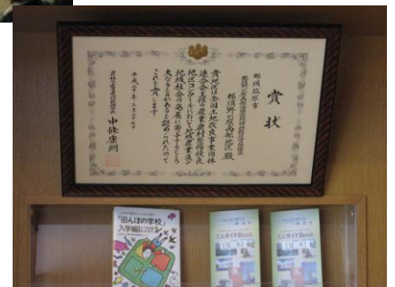
(写真) 総合案内所に掲示

農業農村整備優良地区コンクールとは、生産性の高い農業の展開を積極的に推進している地区、また、地域独自の施設の展開や環境への配慮など、農村の振興を図り、活力と個性ある地域づくりを進めている地区及び団体を対象として、全国水土里ネットが開催しているものです。