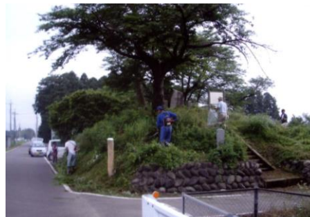
サテライトの維持管理活動