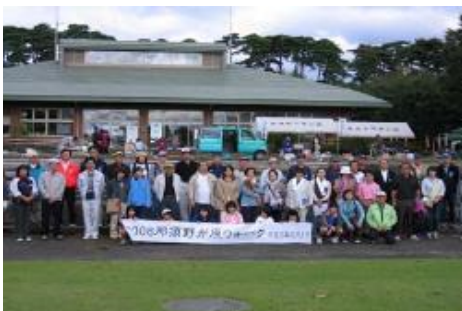
←スタート前に 全員で記念撮影

那須野が原公園 — 松方別邸 — 那須疏水探訪の小径 — 那須疏水第3分水工 — 那須疏水記念碑 — 赤田調整池 — サンサタワー（公園内）