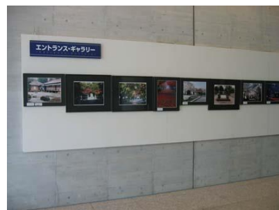
↑ 大山地区の写真展のようす