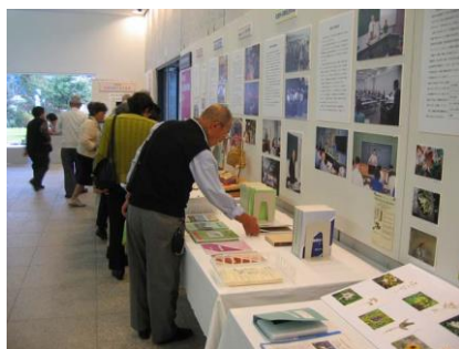
博物館フェスタ（11月3～5日）