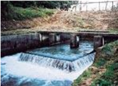
↑ ミニガイドブックに掲載されている写真

ミニガイドブックは総合案内所にありますので、地域を散策の際に是非ご活用ください。