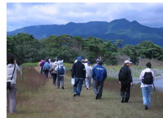
↑ ウォークのようす ↓

ウォークは、柔軟体操・コース説明のあと、那須野が原の風情を楽しみながらおよそ2時間のコースを参加者全員が完歩しました。終了後には、主催者の好意によるお楽しみ抽選会がありウォークの楽しみに花をそえてくれました。