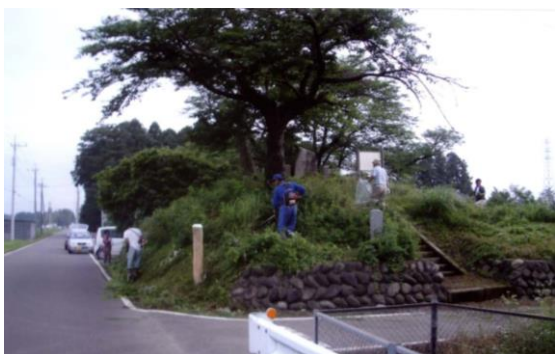
草刈り作業のようす（親王台）

今後は、市や地区の皆様、関係団体などとさらなる連携を図りながら、適切な維持管理に努めていくつもりです。