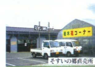
そすいの郷直売所

F 那須開墾社ゆかりのルート（10km：徒歩3時間、自転車1時間） コア施設 → 南コミュニティ（南公民館）[P] → 常盤ヶ丘、長延寺、杏の里 → 旧原街道 → なんじゃもんじゃ → 那須開墾社第一農場跡（親王台） → 縦道 → 花畑 → 南コミュニティ