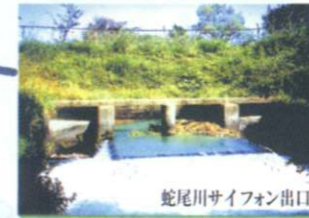
蛇尾川サイフォン出口

G 那須疏水の郷ルート（4.0km：徒歩1.5時間、自転車20分） コア施設 → 西コミュニティ（西公民館）[P] → 雲照寺と石仏・開山堂 → 烏ヶ森 → 那須開墾社事務所堀、第二農場跡（歴史公園） → そすいの郷直売所、那須疏水水車 → 平地林 → 西コミュニティ