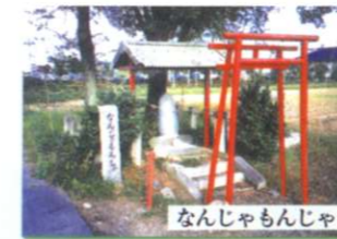
なんじゃもんじゃ

E 那須疏水さわやかルート（6.5km：徒歩2.5時間、自転車40分） コア施設 → 那須野が原公園 [P] → 那須疏水探訪の小径 → 松方別邸 → 千本松牧場（旧松方農場） → 観象台北点 → 那須疏水探訪の小径 → 那須野が原公園 [P]