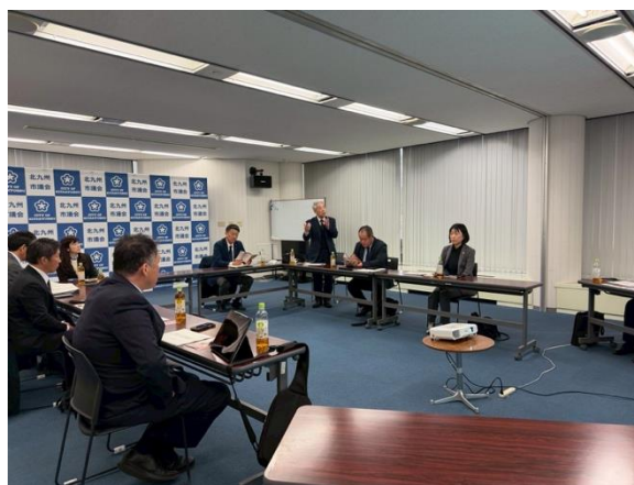
北九州市での研修の様子