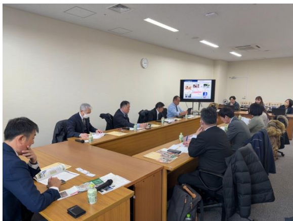
長崎市での研修の様子

今回の視察で本市のこれからの未来事業に繋げるきっかけや、賑わいのあるまち「那須塩原」を作るヒントを得ることができた。