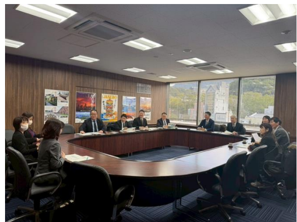
佐世保市での研修の様子

女性活躍推進は、今後の地域経済の発展や地域社会生活の変化に対応するための重要なテーマである。行政・市民・企業など官民連携による、まずは意識改革の醸成、そして施策や事業の実施が人口減少社会の課題解決に繋がると思う。