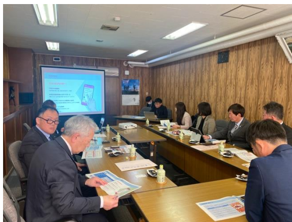
大村市での研修の様子