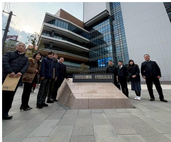
長崎市役所前にて

のある環境づくりなどを進めながらまちの魅力を磨きより賑わいのあるまちとなるよう、市民や事業者と協同し、進化するプロジェクトとして取り組みを進めていき長崎駅周辺やスタジアムシティの整備が進む中まちなかの活力を維持していくために、このような集客拠点からまちなかへの人の流れをつくり、市民と行政が連携しながら新たな賑わいの維持・創出を図り、まちなかに絶えず人がいて、賑わいが生み出される状況を作っていることが成功していると感じた。