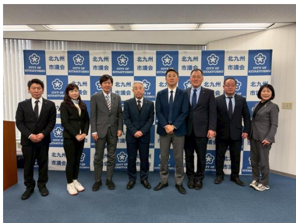
北九州市市議会ボードの前にて

これらの取り組みは、支援を必要とする人を孤立させず、地域全体で支え合う街をつくる実践であり、「助けてと言える社会」を制度と地域の両面から具体化している点が今後の自治体政策を検討する上で、参考となる取組である。北九州市の実践は、今後の自治体における重層的支援体制整備事業の在り方を考える上で、多くの示唆を与えるものであり、本市においても、庁内連携の仕組みづくりと官民連携を検討していく必要があると考える。