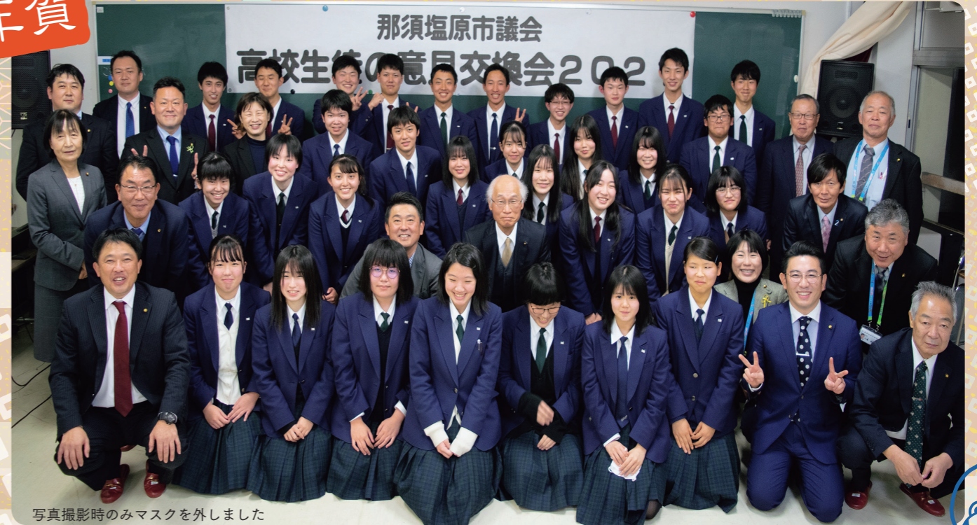
写真撮影時のみマスクを外しました