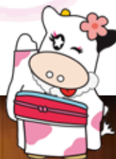
那須塩原市 PR キャラクター みるひい