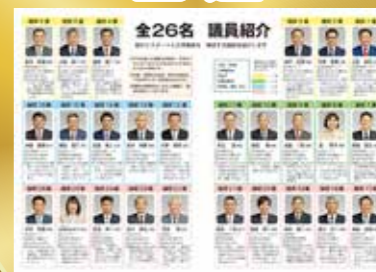
市議会議員選挙当選 ～那須塩原市議会、 新たな4年間の幕開け～

今期4年間の那須塩原市議会の取り組みを、「ぎかいのひととき」の記事とともに振り返ります。