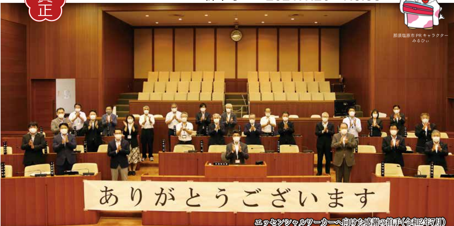
エッセンシャルワーカーへ向けた感謝の拍手(令和2年7月)