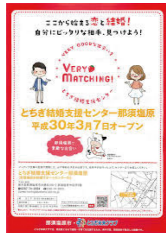
とちぎ結婚支援センター那須塩原