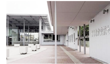
まちなか交流センター

答 那須塩原市いじめ防止基本方針の改正につながった。今回の改正により、いじめを発見次第、状況を確認し対応できる内容となり、一歩前進することができた。