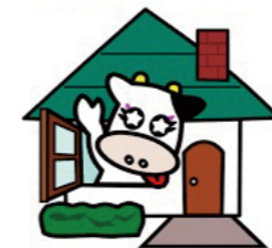
那須塩原市空き家バンク