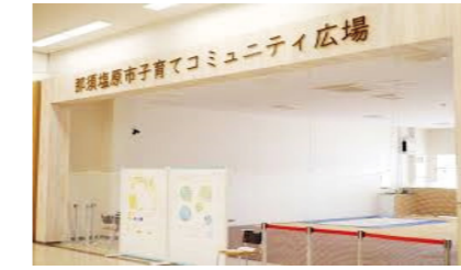
子育てコミュニティ広場

問 再生可能エネルギー推進費のうち、電気自動車購入費が一部執行されなかった理由は。