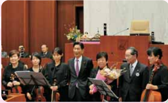
議長・市長と那須室内合奏団の5名