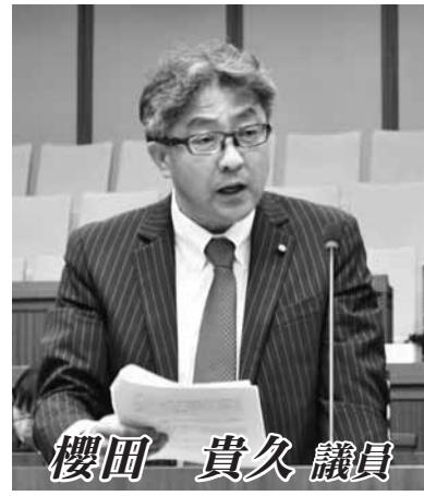
櫻田 貴久 議員