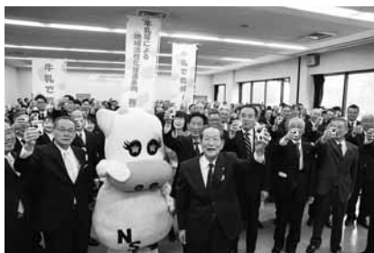
4月1日に行われた牛乳で乾杯セレモニー