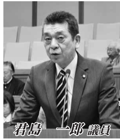
君島 一郎 議員