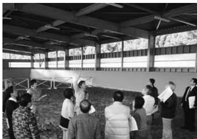
ホースガーデン視察の様子