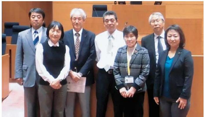
【所管事務調査（東京都町田市・議場にて）】

去る11月7日から8日には、所管事務調査のため、東京都町田市を訪れ、新庁舎建設の経過や議会の対応などについて視察を行いました。また、東京臨海広域防災公園では、防災体験学習施設で地震災害への備えについて学び、同公園で行われた全国消防操法大会を見学、市内消防団の活躍を応援しました。