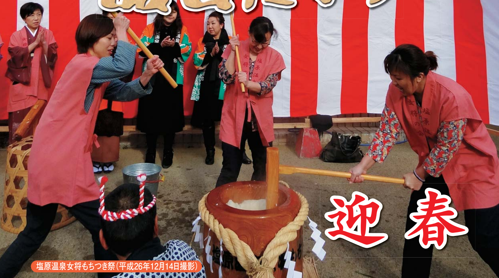
塩原温泉女将もちつき祭(平成26年12月14日撮影)

新年号 (第55号) 平成27年1月5日発行 栃木県那須塩原市 議会だより編集委員会 議会事務局 TEL0287-62-7181