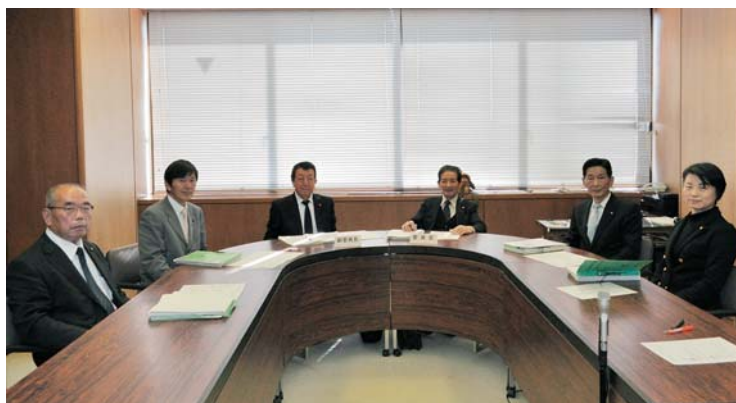
～議案審査終了後の委員会室にて～

今後においても、身近で行われている様々な取組に目を向け、地域の特色を生かした施策の実現に努めてまいります。