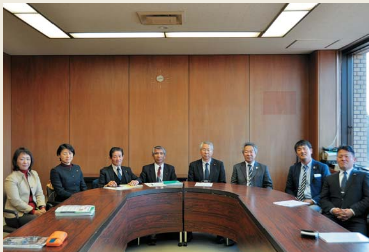
現在の委員構成は平成27年4月まで