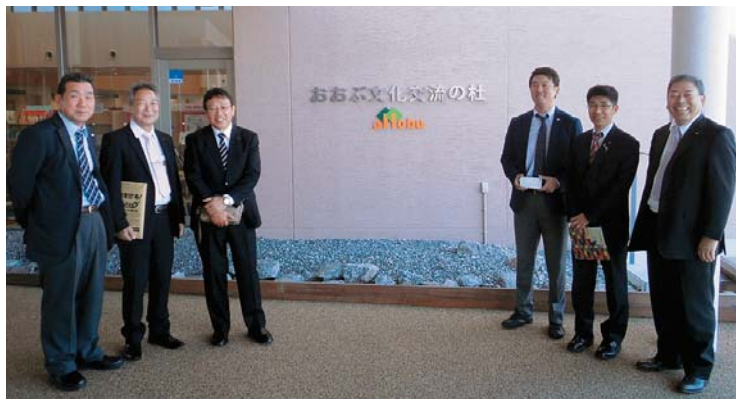
【所管事務調査（愛知県大府市） ～おおぶ文化交流の杜にて～

今後、多角的視点をもって、市民ニーズを市政へ繋げるよう取り組んでまいりたいと思っております。