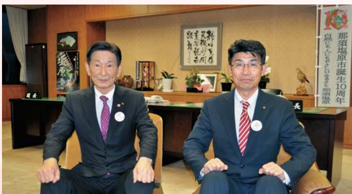
議長 中村 芳隆 副議長 吉成 伸一

市議会といたしましても、市民の皆さまと心ひとつに、記念すべき合併十周年のメインの年度となるため、次の時代に向けて力強い一歩を踏み出していけるよう、議員一同、議会活動に邁進してまいります。皆さまにとって、素晴らしい一年となりますようご祈念し、念頭のご挨拶とさせていただきます。