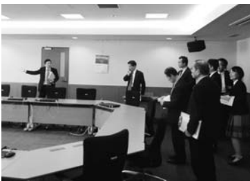
東京都青梅市視察 (平成26年10月28日)

委員会においては、同懇談会と同様の「庁舎を拠点としたまちづくり」「新庁舎に求めるサービス内容」「整備位置」「整備時期」についての基本構想に関する4項目を中心に検討を重ねることとし、来年2月には提言できるようなスケジュールを進めていくことが確認されています。現在まで4回の委員会を開催し、現庁舎の課題としてあげられている有効スペース活用などについての協議があったほか、10月28日(火)には、新庁舎の位置及び適正規模、必要となる施設、設備、機能等についての事例を参考にするため、先進地である東京都青梅市(人口約13万7千人)を視察しました。本特別委員会の会議経過等については、今後も議会だより等を通じてお知らせしていきます。