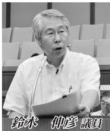
鈴木 伸彦 議員