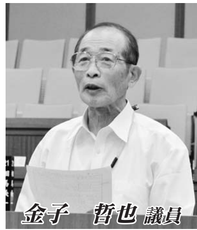
金子 哲也 議員

問 本市の国際交流が、どれだけ重要な部署になるか、どれだけ力を入れていく気があるか、どれだけ行政が仕掛けづくりをしていく気があるのか、その意気込みを伺う。