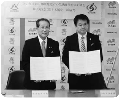
相互応援協定締結式 (平成26年10月10日)