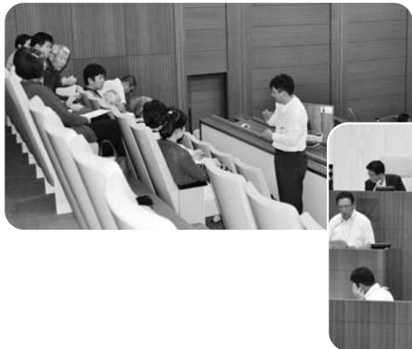
議場内で初めて行われた手話通訳の様子 (平成26年9月30日)

日本国憲法は、過去の悲惨な戦争と専制政治を反省し、人々の平和と民主主義の渴望の中から生まれたものである。戦争のない平和なアジアと世界を願う国民は、安倍内閣の閣議決定による憲法解釈に強く抗議するとともに、その撤回を求める。