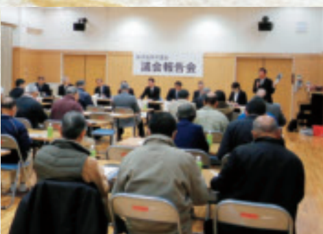
第2回議会報告会の様子 (稲村公民館)

なお、議会報告会の開催結果及び12月定例会の詳しい内容につきましては、2月20日発行の議会だより（第51号）でお知らせいたします。