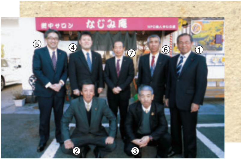
【所管事務調査 (市内現地調査)】 ～街中サロン「なじみ庵」の運営について～

今後ますますグローバル化が進み多様な人材が求められています。急速に少子高齢化、人口減少が進む中、子育て支援の充実と市の将来を担う青少年の育成に力を入れ、世界に羽ばたく人間教育に全力で取り組んで参ります。