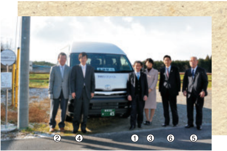
【所管事務調査 (市内現地調査)】 ～予約ワゴンバス及びゆ～バスの運行状況について～

市内の様々な団体との交流や課題研究を積極的に行い、組織や地域の壁を越えた総合的な視点と、時機を逸しないスピード感をもって、委員一人一人の力を尽くして参ります。