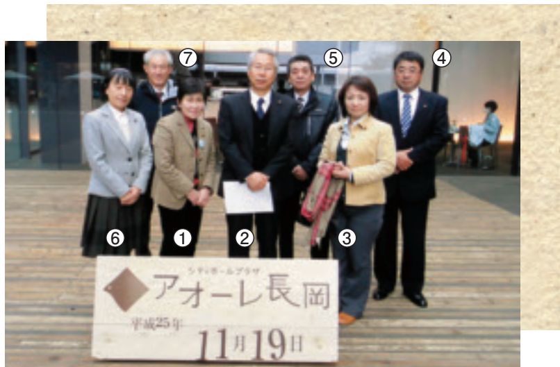
【所管事務調査 (新潟県長岡市視察)】 ～市民協働と交流の拠点、アオーレ長岡について～

総務企画常任委員会が審査や調査をする案件は、市の組織である総務部、企画部、会計課、議会事務局、選挙管理委員会事務局、監査委員事務局、公平委員会、固定資産評価審査委員会、西那須野支所及び塩原支所が所管するもの、並びに他の所管に属さないものです。 【主な所管事務】 ・ 市の企画・政策や情報管理に関すること ・ 市職員の人事や市庁舎、財産、財政の管理に関すること ・ 放射能対策や防災対策、消防に関すること ・ 市税の賦課徴収に関すること ・ 西那須野・塩原支所に関することなど 去る11月19日から20日には、所管事務調査のため、新潟県長岡市を訪れ、市民協働・交流拠点となる新しい市役所建設の実態や国際交流、震災復興の取り組み状況について視察を行いました。参考になったものも多く、今後の議会活動に活かして参ります。