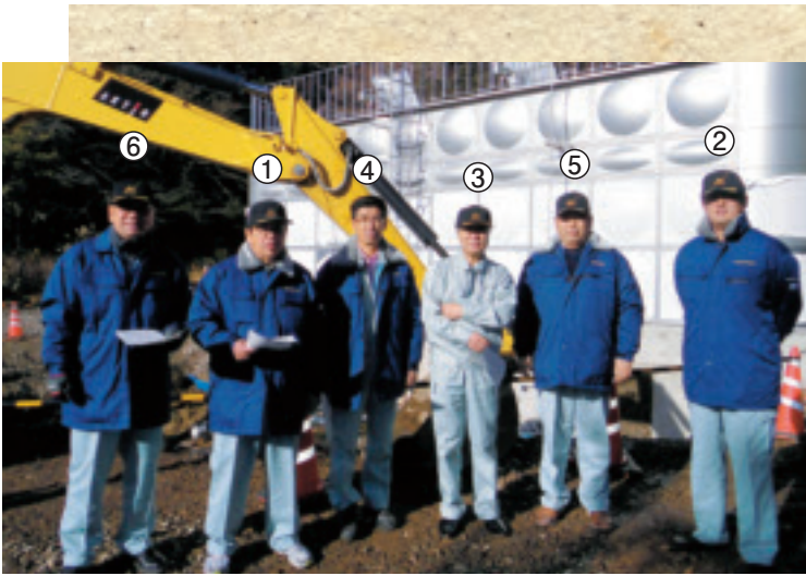
【所管事務調査 (市内現地調査)】 ～板室本村浄水場・東那須野金田線について～

市民生活における利便性向上、安全の確保のためには、インフラ整備等は重要課題であります。市が行う事業の効果等を正しく判断するとともに、地域における問題を的確にとらえ、政策を提言して参ります。