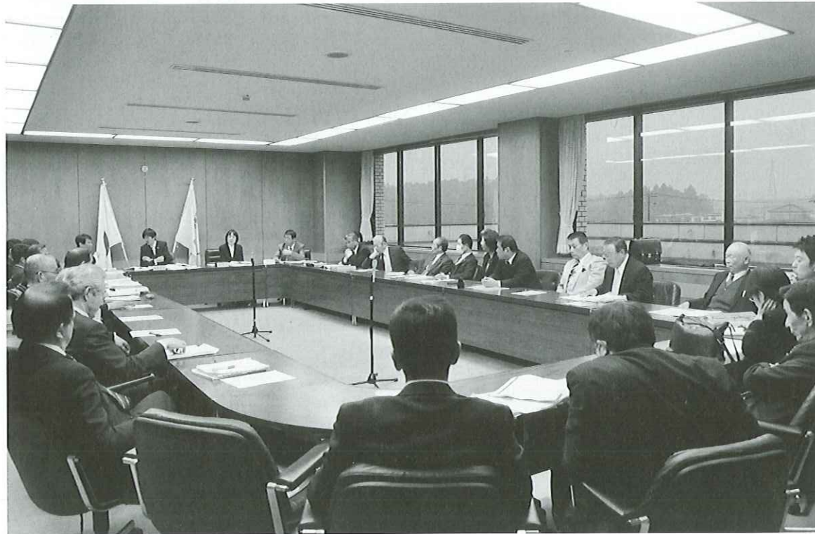
今回の3月定例会より設置した予算等審査特別委員会における審査の様子

那須塩原市の持つ可能性を引き出し、市政の更なる発展に向けたスタートの年として計上