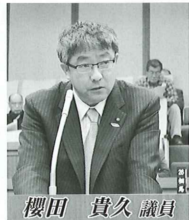
櫻田 貴久 議員

ホームページやツイッターなどを活用し、旬の情報を発信している。黒磯駅周辺整備について 市政運営方針に示した駅前広場整備の概要及び進捗は。 建設部長 安全で便利な広場利用を確保し、駅周辺地域の活性化に資するため、東口広場、西口広場、駐車場及びふれあい広場の整備を計画している。