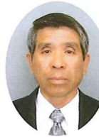
たかく こういち 高久 好一 (日本共産党 革新共同)