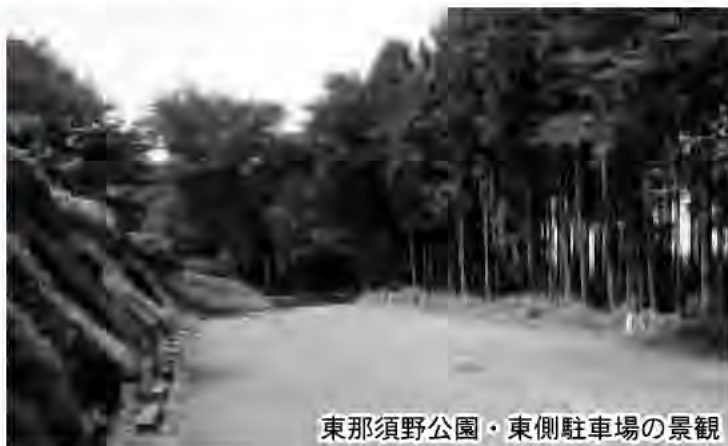
東那須野公園・東側駐車場の景観

答 建設部長 今後の市全体の都市公園整備の見直し等を行うので、研究課題とさせていただきます。