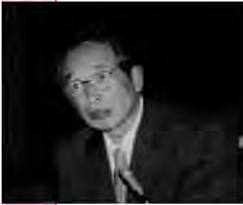
金子 哲也 議員