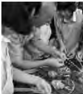
ほたるかご “蛸籠編み”伝習会 ＝6月24日開催

答 産業観光部長 西那須野地区に現在までに地域高齢者などを対象とした生きがいづくりと市街地活性化を目的に、街中サロン「なじみ庵」を開設した。黒磯駅前地区においては黒磯商工会と連携し、チャレンジショップの開設及び新規創業者の支援事業を実施している。今後も商業商店街の活性化対策に取り組んでいきたい。