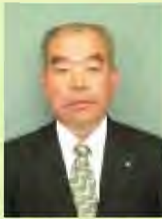
人見 菊一 議員