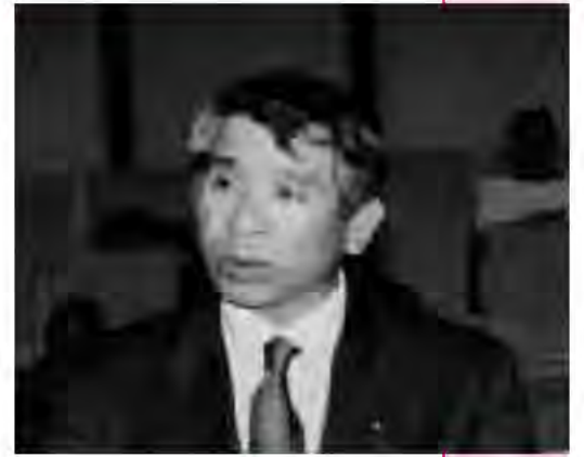
高久 好一 議員