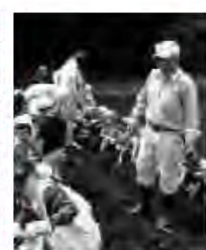
たかはやし保育園児のいも掘りを見守るおじいちゃん先生

答 市民福祉部長 保育園整備計画の中で、老朽化施設等を十分調査研究したいと考えている。