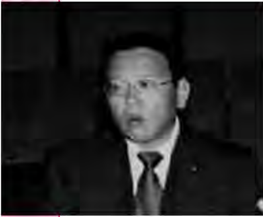
眞壁 敏郎 議員