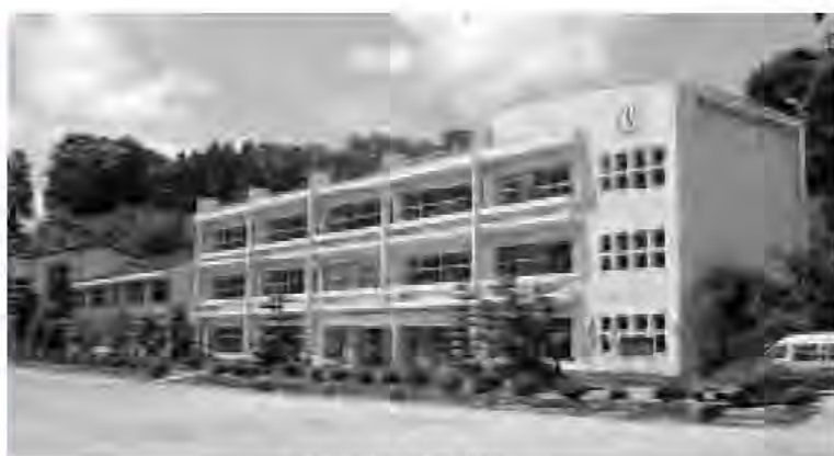
現在の塩原中学校

答 教育部長 現在、塩原小中学校の水泳の授業は、塩原B&G海洋センターのプールでスクールバスの送迎により実施され、授業時間の確保はされている。学校の敷地面積等の問題もあり、プールの新設は厳しい状況にある。