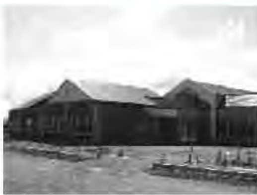
9月供用開始に向けて整備中の西那須野公民館

これら2件は、現在、太夫塚地内に建設を進めている体験学習施設に、本年9月1日から新たに図書館分室を設置するとともに、東小学校内に設置している東児童クラブを同施設内に移設することに伴う位置を変更するために改正するものです。