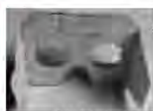
京あんしん子ども館の“幼児視野体験眼鏡”