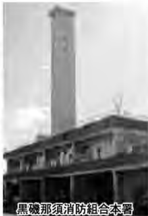
黒磯那須消防組合本署

答 市長 老朽化が進んでおり、早い時期の建て替えに向けて検討する必要があるとは認識しているが、本部の広域合併も視野に入れながら、候補地の検討などをしていかなければならないと考えている。さらに、関係機関との協議をしていかなければならないと思っている。