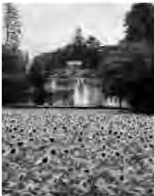
青木別邸前のひまわり

糖質資源（さとうきび、てんさい）、でんぷん資源（とうもろこし等）、油脂資源（なたね、大豆、落花生等）