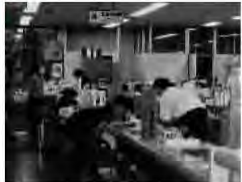
市民・福祉部門の窓口は利用者が多い。金曜日午後6時半＝黒磯庁舎1階

問 1年間利用が極端に少ない部門もサービスということが続けている意味はあるのか。これからはコスト意識を持って決断してほしい。