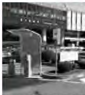
那須塩原駅西口駐車場に導入された管理機械

市営那須塩原駅西口駐車場の管理方法を、7月1日から管理機械を導入して24時間供用とし、使用料を市営那須塩原駅東口駐車場と同様とするために改正するものです。