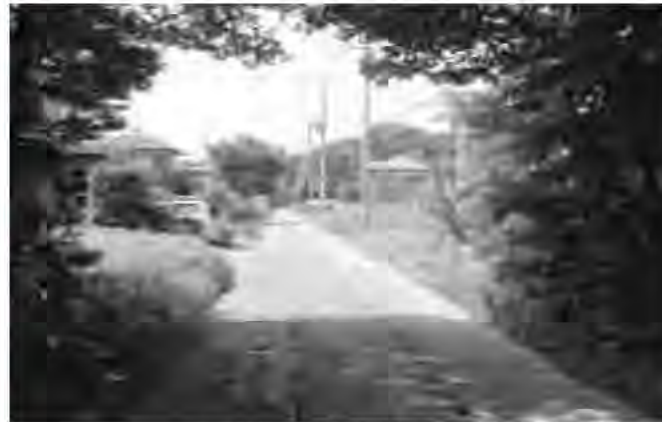
木々が生い茂る新興住宅地の様子

いう制度になっている。従って、自治会組織等の中から通学路に設置する防犯灯設置についての申請がある場合は、優先して設置補助を検討していきたいと考えているが、防犯灯を市が設置、管理するという考えは、現在のところない。