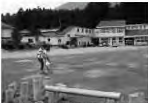
地域住民等の協力で運営される田舎ランド鳴内

答 産業観光部長 ②田舎ランド鳴内、大日尊までの道路、一本杉への観察路、休憩所、トイレ等が整備された。今後、これらの施設を周遊する観光コースとして、ふるさと林道を活用していきたい。③やしおつつじの園地としての整備については、この園地を利用している団体や地権者等の関連もあり、今後十分に検討していきたい。