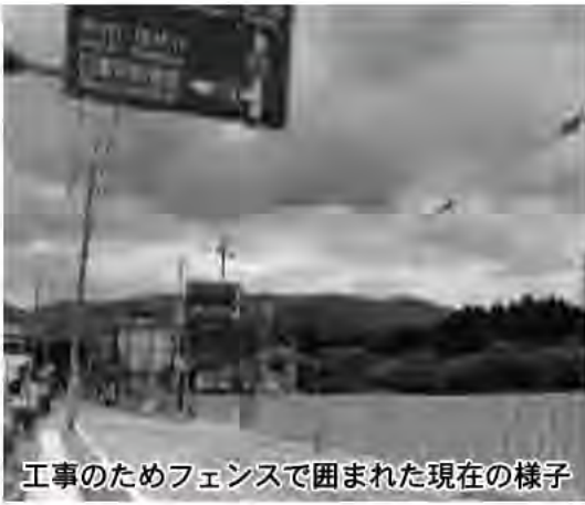
工事のためフェンスで囲まれた現在の様子

工事の概要は、鉄筋コンクリート造、一部鉄骨造2階建て、延床面積1710.85㎡の庁舎棟及び車庫棟、屋外トイレを建築するものです。