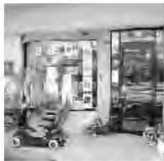
街中サロンなじみ庵 (昨年11月開設)

地域の高齢者を主役に各種教室や世代間交流の場として様々な伝習会などが行われている。