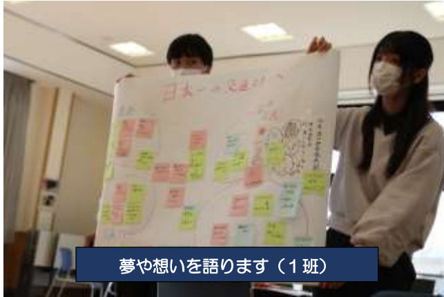
夢や想いを語ります (1班)