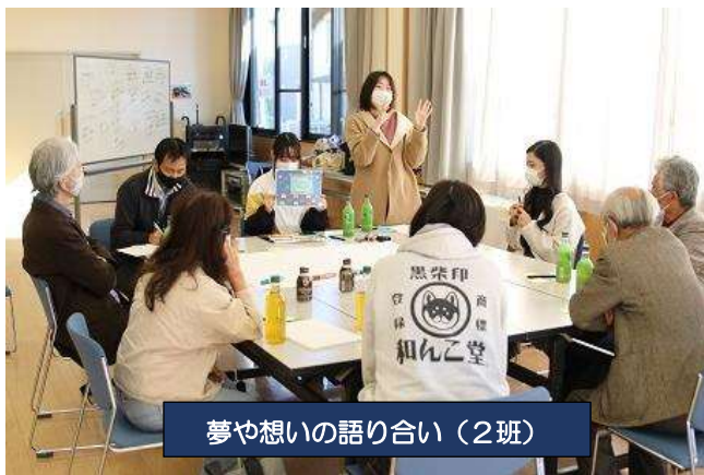
夢や想いの語り合い（2班）