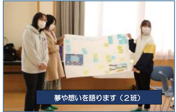
夢や想いを語ります (2班)