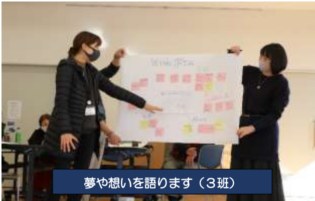
夢や想いを語ります (3班)