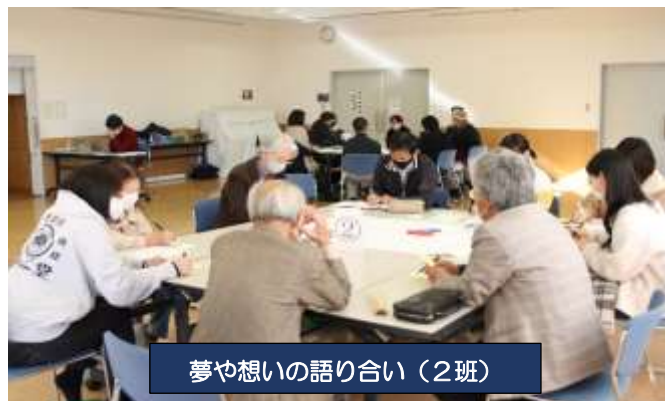
夢や想いの語り合い（2班）