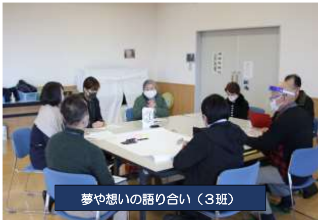
夢や想いの語り合い（3班）