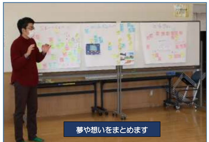
夢や想いをまとめます