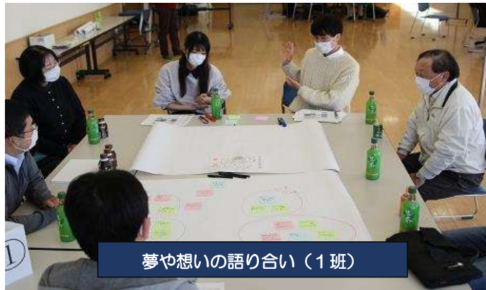
夢や想いの語り合い（1班）