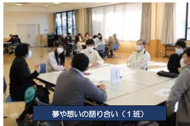
夢や想いの語り合い（1班）