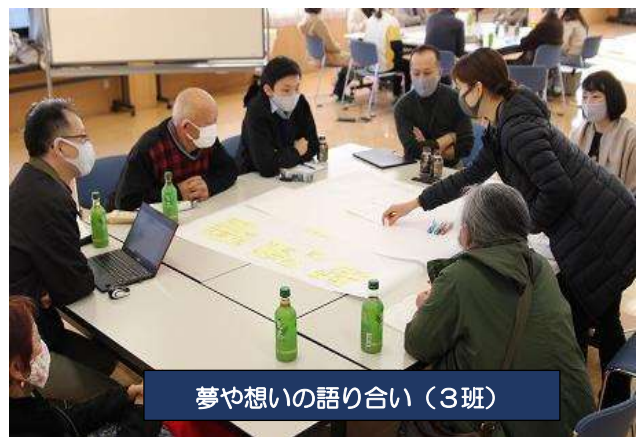
夢や想いの語り合い（3班）