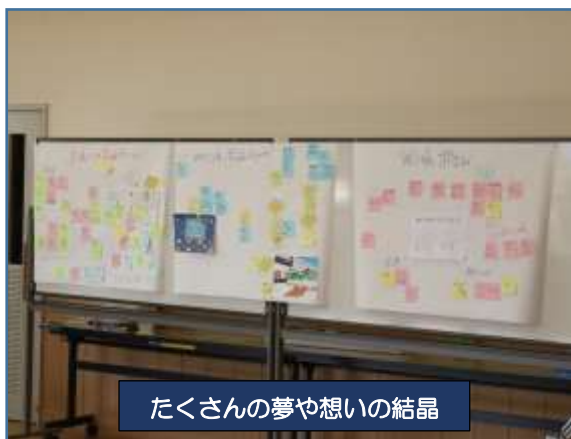
たくさんの夢や想いの結晶