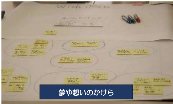
夢や想いのかけら