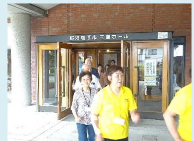
C:ウォーキング教室