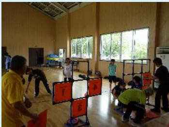
A:少年教室(ディスクッター)