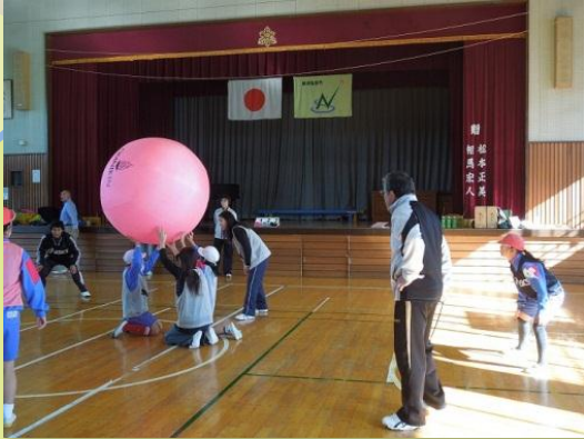
槻沢小学校5年生親子レク（12/6）