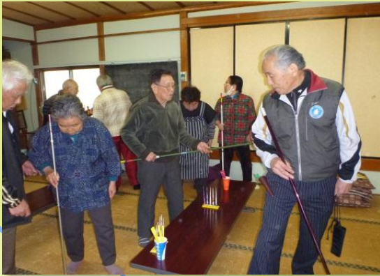
塩釜生きがいサロン（3/14）