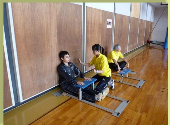
市民体力テスト長座体前屈