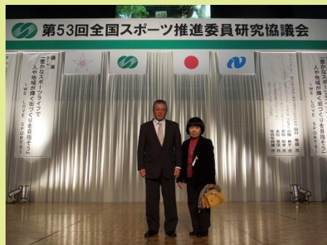
全国スポーツ推進委員 研究協議会にて