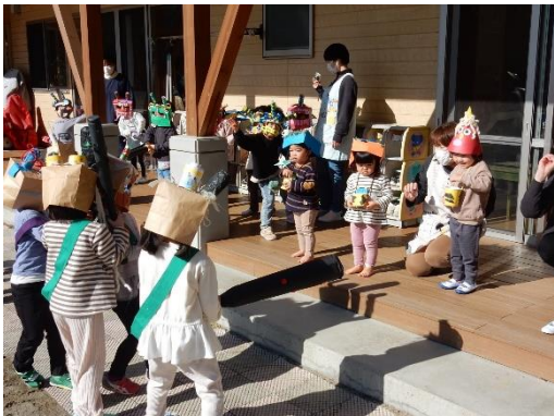
かわいい小鬼が現れた！

寒さが厳しい2月2日、塩原認定こども園の子供たちが豆まきに挑戦しました。今回は、年長さんが「自分たちが克服したいことを見立てた」鬼に扮し、年下の子供たちが鬼に豆を投げつけていました。するとそこに大きな鬼が登場。今まで鬼役をしていた年長さんたちも一緒になって大きな鬼に豆をぶつけ、怖い鬼をやっつけました。