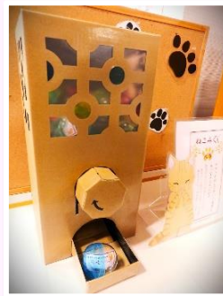
オリジナル ガチャガチャおみくじ

2月から3月にかけて引き続き「猫」をテーマに展示を行っています。展示の資料を借りてくださった方にはしおりをプレゼント！さらに、となたでも無料で参加できる「ガチャガチャおみくじ」も実施しています。運だめしも兼ねてぜひご来館ください。 ※なくなり次第終了です。