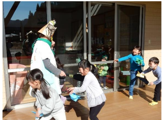
怖い大鬼をやっつけろ！！