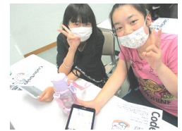
見づらいかもかもしれませんが、画面内には「みるひい」もいます。

7月9日(日)わんぱくチャレンジ塾は昨年も大人気だった「プログラミング教室」です。