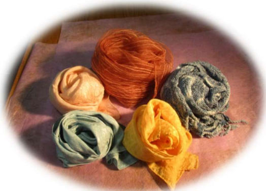
ストール完成品(イメージ)