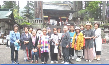
パワースポットはこの先です。