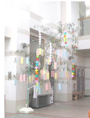
皆の願いが叶うことを祈ります!