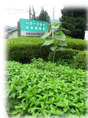
ハロープラザで育てた藍を使います