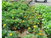
ありがとうございます。 順調に育っています。

6月24日(土)今年も「宇都野あすなろ会」の皆様にはハロープラザの花壇に花の苗を植えていただきました。