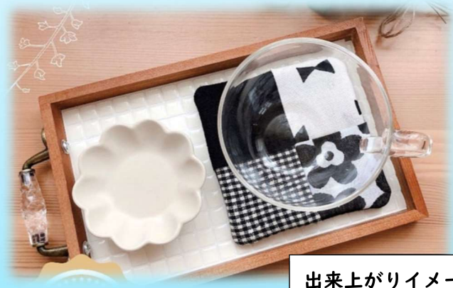
出来上がりイメージ