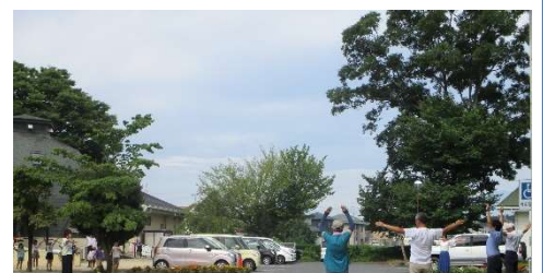
ラジオ体操の様子