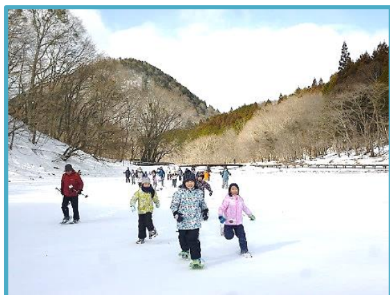
スノーシューのようす