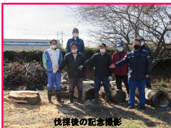
伐採後の記念撮影