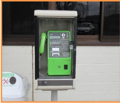
設置されたようす

令和3年12月17日(金)にNTT東日本からの設置依頼により、大山公民館に第一種公衆電話が設置されました。第一種公衆電話は、社会生活上の安全及び戸外における最低限の通信手段を確保する観点から、市街地においては概ね500m四方に1台等設置すると総務省の基準となっていますが、大山公民館周辺500m四方には公衆電話がありません。地震等の災害時には、ご自宅の電話や携帯電話の発信規制がおこなわれ、電話がかかりにくくなりますが、公衆電話はこの規制の対象外となります。緊急時や災害等における地域の方々の通信手段を確保する場所として大山公民館に設置されました。