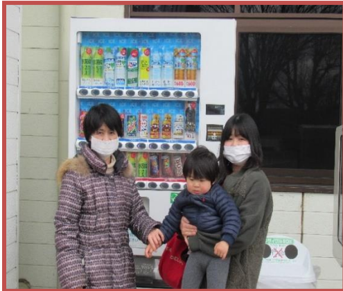
設置されたようす

長年にわたり公民館利用者等に利用されてきたダイドードリンコの自動販売機が、このコロナ禍で収益が上がらない等の理由で令和3年11月19日に撤去されました。