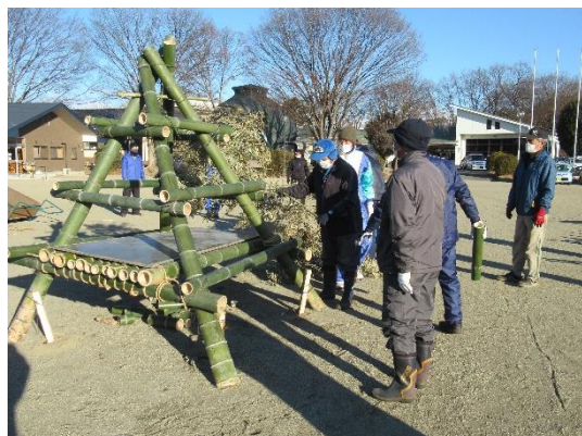
これがこだわりの職人芸です

当日は絶好の作業日和となり、前もってのコミュニティ役員の皆さんの下準備もあり、作業が順調に進み、本番を迎える態勢がすっかり整いました。ご協力いただきました皆さんの力は、まさに“大山地区の伝統を守る力”であると共に、成功への手形であることを示していました。