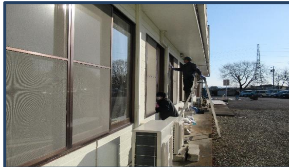
会議室の外窓もピッカピカ