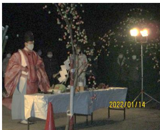
地域の安全と繁栄を祈禱しました

心配された天候は、風も弱まり無事お焚き上げでき、地域の皆様の思いとして天をめざした炎が舞い上がりました。