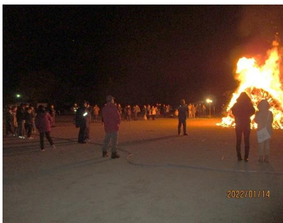
天をめざした炎が燃え上がりました