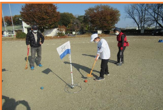
世代を越えた交流です

恒例となりました晩秋の世代間交流によるグラウンドゴルフ大会が11月20日(土)81名の皆さんが参加し大山コミュニティグラウンドで開催されました。体育レク部会と高齢者部会が合同で諸準備に汗を流し、安全にできる体制を確認しながら備えました。当日は世代の交流が図れるよう班分けを工夫し、各グループは和気あいあいと、そして助け合いながらプレーに集中し、大会の所期の目的を達成していました。