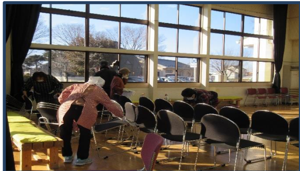
ホールもきれいになりました

年末の大掃除が12月23日(木)に公民館利用団体26団体：46名の皆さんのご協力により一年間の汚れが取れて、きれいになりました。新年を迎える準備ができ、これで皆さんに引続き気持ちよく利用していただけます。