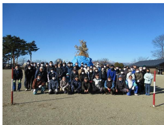
私たちが大山地区の伝統を守ります