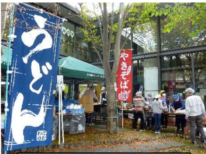
三島：うどん・やきそば