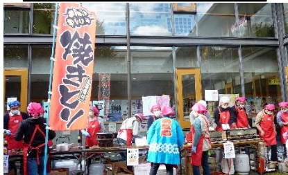
西三島：やきとり・ギョーザ