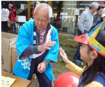
スタンプラリー、じゃんけんポン！