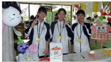
カレンダー販売など