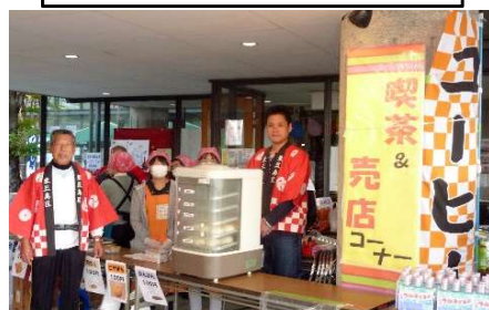
東三島：喫茶コーナー