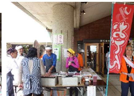
南郷屋・五軒町：おでん