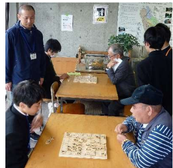
三島中・将棋部員と真剣試合！