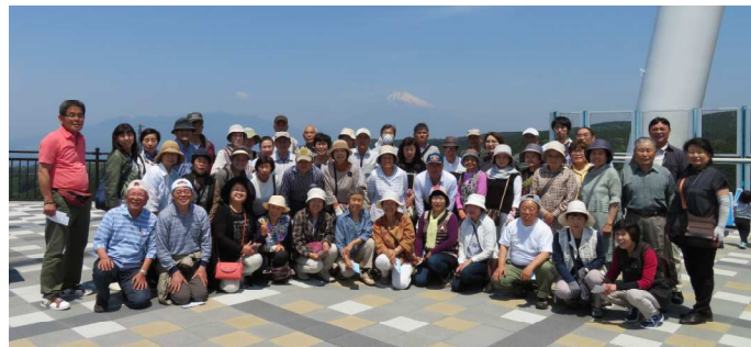
富士山をバックに

全長400m 日本一長い大吊橋「三島スカイウォーク」に立ち寄り、この大吊橋から日本一高い富士山、日本一深い駿河湾の絶景を望むことができました。午後は、三嶋大社参拝、沼津港商店街でお買い物。吹く風も心地良いさわやかな一日を満喫しました。