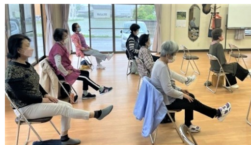
南郷屋 <いきいき百歳体操>