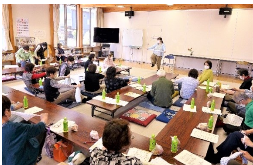
西三島 <元気もりもり講座>