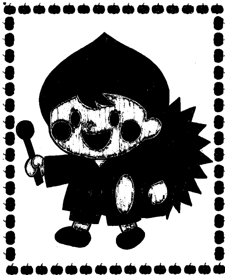
西地区マスコットキャラクター「くりぼうや」